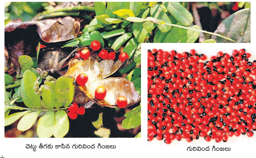
చెట్టు తీగకు కాసిన గురివింద గింజలు

- వరంగల్, డిసెంబర్ 13 (నమస్తే తెలంగాణ ప్రతినధి)