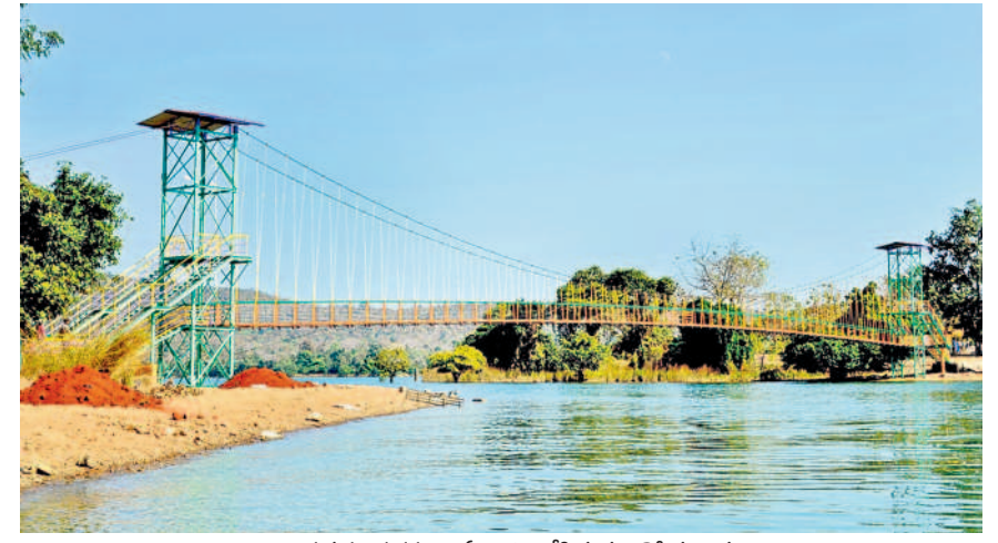
లక్కవరం సరస్సుపై ఏర్పాటు చేసిన మూడో వంతెన

పనులు పూర్తి కాకుంటే భక్తులకు ఇబ్బందులే జాతీయ రహదారి మీదుగా మేడారానికి వివిధ వాహనాల్లో భారీ ఎత్తున తరలివచ్చే భక్తులకు ఎన్హెచ్ విస్తరణ పనులు అడ్డంకిగా మారనున్నాయి. జాతరలోగా గట్టమ్మ దేవాలయం వరకు పూర్తి కానట్లయితే వాహనాలు రోడ్డు ప్రమాదానికి గురికావడంతో పాటు ట్రాఫిక్ సమస్య తీవ్రంగా తలెత్తే అవకాశం ఉండనున్నది. ఏటా జాతరకు నెల రోజుల ముందు నుంచే భక్తుల తాకిడి మేడారానికి పెరుగుతుంది. అది కూడా హనుమకొండ నుంచి ములుగు మీదుగా ఎక్కువ సంఖ్యలో భక్తులు తరలివస్తారు. ఎన్హెచ్ విస్తరణ పనులు ఆలస్యం కావడంతో మేడారం భక్తుల తాకిడికి పనులు మరింత ఆలస్యమయ్యే అవకాశం ఉంది. ఇదిలా ఉండగా, ములుగు జిల్లాలో పనిచేస్తున్న ఉన్నతాధికారులందరూ నిత్యం హనుమకొండ నుంచి రాకపోకలను కొనసాగించే వారే. జాతరను దృష్టిలో ఉంచుకొని పనుల వేగవంతానికి తగిన చర్యలు తీసుకోవడంలో సంబంధిత అధికారులు నిమగ్న నీరెత్తినట్లు వ్యవహరించడం, వారి అలసత్వ దోరణికి భక్తులకు తిప్పలు తప్పేలా లేవు. ఏదేమైనా జాతరకు నెల రోజులకు ముందు ప్రస్తుతం జరుగుతున్న ఎన్హెచ్ విస్తరణ పనులు గట్టమ్మ దేవాలయం వరకు చేరాలేవు. జాతరకు వచ్చే భక్తులకు వాహనపరమైన ఇబ్బందులను అధికారులు ఏ మేరకు తరిగివేస్తారో చర్యలు చేపడుతారో వేచి చూడాలని అవసరం ఉంది.