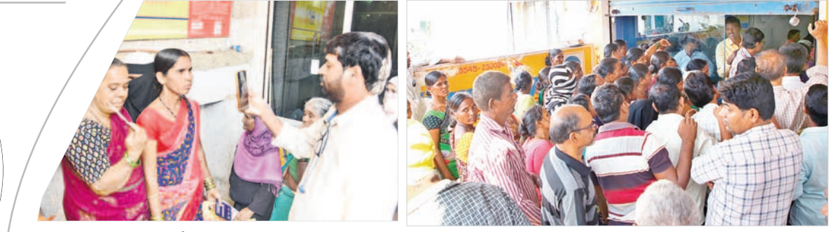
మహబూబ్ నగర్ ఈ కేవైసీ చేస్తున్న ఏజెన్సీ నిర్వాహకులు

మహబూబ్ నగర్, డిసెంబర్ 13 : మహా గ్యాస్ సిలిండర్ ధర తగ్గుతుందని, ఈ కేవైసీ చేయించుకోవాలని తెల్లవారక ముందే గ్యాస్ ఏజెన్సీ కార్యాలయాల వద్ద వినియోగదారులు బారులు తీరుతున్నారు. రాష్ట్ర ప్రభుత్వం మహిళా భరోసా పథకం కింద గ్యాస్ సిలిండర్ రూ.500లకే అందించేందుకు, ఈ కేవైసీ ఎలాంటి సంబంధం లేదని ఏజెన్సీ నిర్వాహకులు తేల్చి చెబుతున్నారు. సోషల్ మీడియాలో వస్తున్న దుర్బ్రాచారాలను సమర్థవంతంగా సంబంధిత అధికారులు చెబుతున్నారు. గ్యాస్ కంపెనీలు వినియోగదారుల నుంచి వేలిముద్రలు తీసుకొని ఈ కేవైసీ చేయాలని ఆయా గ్యాస్ ఏజెన్సీల నిర్వాహకులకు ఆదేశించడం జరిగింది. ఈ విషయం సంబంధిత డివిజన్ అధికారులకు కూడా సమాచారం లేదు. కాగా, కాంగ్రెస్ ప్రభుత్వం ప్రకటించిన రూ.500ల గ్యాస్ సిలిండర్ రావాలంటే ఈ కేవైసీ చేయించుకోవాలని సోషల్ మీడియాలో పుకారా వడంతుతో వినియోగదారులంతా ఏజెన్సీ కార్యాలయాల వద్ద బారులుతీరుతున్నారు. ఈ విషయంపై సంబంధిత అధికారులు ఈ కేవైసీకి ఎలాంటి తొందర లేదని, ఎప్పుడైనా చేయించుకోవచ్చని సూచిస్తున్నారు.