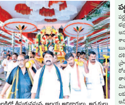
రామయ్యను పట్టించుకుంటున్న భక్తులు