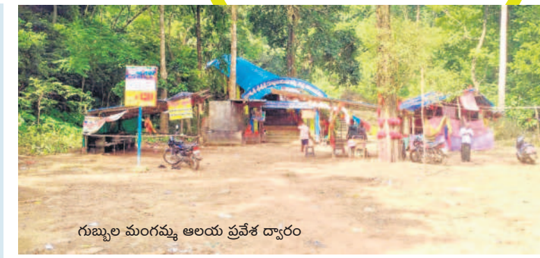
గుబ్బల మంగమ్మ ఆలయ ప్రవేశ ద్వారం

ఆకర్షణీయంగా ప్రకృతి అందాలు దట్టమైన అటవీప్రాంతంలో ఉన్న గుబ్బల మంగమ్మ ఆలయం అంతా ప్రకృతి అందాలతో భక్తులను ఆకర్షిస్తున్నది. ఆలయంలోకి ప్రవేశించే దుకు సుమారు 5 కిలోమీటర్ల ముందే అటవీ మార్గం ప్రారంభమవుతుంది. పచ్చని ప్రకృతి అందాలు భక్తులకు స్వాగతం పలుకుతాయి. మట్టి రోడ్డు గుండా ఆలయం వద్దకు భక్తులు చేరుకుంటారు. భారీ వృక్షాలు, పక్షుల కిలకిలలు, పెద్ద రాళ్లు, ఎత్తైన కొండలు, కాల్బాట పక్కనే పారే వాగు, ప్రశాంతమైన వాతావరణం భక్తులను కనువిందు చేస్తాయి. వేసవికాలంలోపాలు ఏడాది పొడవునా ఆలయంపై జాలువారే జలపాతం భక్తులు, పర్యాటకులకు ఆహ్లాదాన్ని పంచుతున్నది. జలపాతం నుంచి వచ్చే శబ్దాలు సంగీతంలా భక్తులు ఆస్వాదిస్తుంటారు. జాలువారే జలపాతం కింద భక్తులు స్నానాలు ఆచరించి అమ్మవారికి మొక్కులు తీర్చుకుంటారు. ఆలయంపై పారే జలపాతం ఎక్కడ నుంచి వస్తుందో నేటికీ అంతపట్టిన రహస్యం.