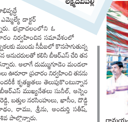
రామయ్యను పట్టించుకుంటున్న భక్తులు

రామయ్యను పట్టించుకుంటున్న భక్తులు రామయ్యను పట్టించుకుంటున్న భక్తులు