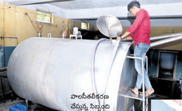
పాలసేతలికరణ చేస్తున్న సిబ్బంది

భద్రాద్రి కొత్తగూడెం, డిసెంబర్ 13 (సమస్తే తెలంగాణ): ఆరోగ్యాన్ని కాపాడుకోవాలంటే ప్రతిఒక్కరూ రోజుకు 200 మి.లీ పాలైనా తాగాలని సైంటిస్టులు, నూట్రీషియన్లు సూచిస్తుంటారు. మనం తాగే పాలన్నీ మంచివా..? స్వచ్ఛమైనవా..? అంటే కానే కాదు. కానీ 'మా సంస్థ నుంచి బహిరంగ మార్కెట్లోకి వచ్చే పాలు స్వచ్ఛమైనవి..' అని ఘంటాపథంగా చెప్పే వ్యూహం లక్ష్యదేవిపల్లి పరిధిలోని విజయ డెయిరీ నిర్మాణాలు. ప్రపంచవ్యాప్తంగా సడిచే ఈ డెయిరీ ద్వారా ప్రత్యక్షంగా పరోక్షంగా పండలాది మంది పాడి రైతులు, సిబ్బంది ఉపాధి పొందుతున్నారు.