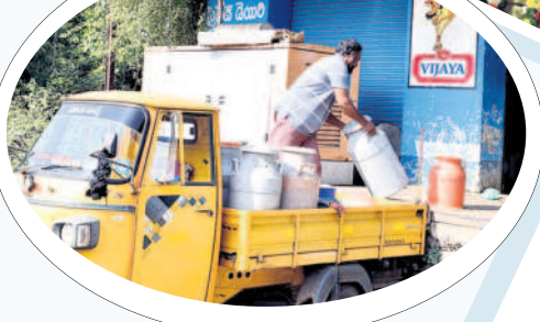
లక్ష్మీదేవిపల్లిలో పాలు సేకరించే కేంద్రం