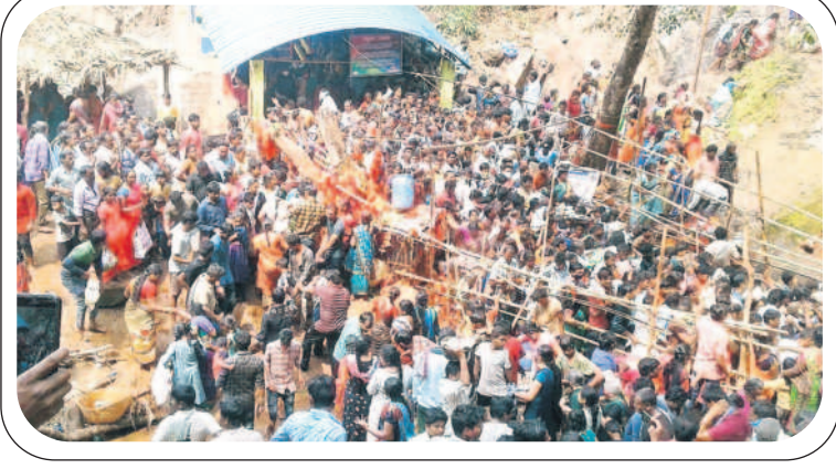
ఆలయం వద్ద కిక్కిరిసిన భక్తులు

అశ్వాసాపుడి, డిసెంబర్ 13 : తెలంగాణ- ఆంధ్ర ప్రదేశ్ రాష్ట్రాల సరిహద్దు పూర్తిగా అటవీప్రాంతంలో ఉన్న గుబ్బల మంగమ్మ ఆలయం భక్తుల కోర్కెలు తీర్చే అమ్మవారిగా ప్రసిద్ధి చెందింది. ఆలయంపై జాలువారే జలపాతం ప్రత్యేక ఆకర్షణగా నిలుస్తున్నది. ప్రకృతి సోయగాల మధ్య పచ్చని వాతావరణం భక్తులకు పారవశ్యం చేసేలా అభవదానిస్తున్నది. అమ్మవారి సేవలో కొండరెడ్డి గిరిజనులు పూజలు చేయడమే కాకుండా భక్తులకు సేవలు అందిస్తున్నారు. ప్రకృతి సిద్ధంగా స్వయంభువుగా వెలిసిన గుబ్బల మంగమ్మ తల్లి ఆలయం పర్యాటక కేంద్రంగా దినదినాభివృద్ధి చెందుతున్నది. ప్రతిపది అక్కల మంది భక్తులు అమ్మవారిని దర్శించుకుని అనంతరం తెలంగాణ- ఆంధ్రప్రదేశ్ సరిహద్దు వివాదంతో ఆంధ్రప్రదేశ్ రాష్ట్రం ఏలూరు జిల్లా జిల్లాకొండరెడ్డి గూడెం దేవాలయశాఖ అలయాన్ని స్వాధీనం చేసుకుంది. సరిహద్దు వివాదం తీవ్రస్థాయికి చేరడంతో భద్రాచలం ఐటీడీఏ ఏలూరు జిల్లా కల్యాణం క్రీతం స్వయంభుగా వెలిసి భక్తులకు దర్శనమిచ్చింది.