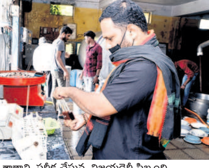
వెన్నతాణాన్ని పరీక్ష చేస్తున్న విజయరైల్వీ సిబ్బంది

ఎవ్ కలిగిన పాలకు ప్రీమియం ధర కల్పిస్తున్నది. పాడి రైతుల ఇంట పెండ్లి జరిగితే ఆ వేడుకకు యాజమాన్యం 'విజయ పెండ్లి కానుక' పథకం ద్వారా రూ.5 వేలను కానుకగా ఇస్తున్నది. బిల్స్ మిల్క్ నింటర్లో నాణ్యమైన ఎక్కువ పాలు పోసే పాడిరైతులకు రూ.2,116 వగదు ప్రోత్సాహకాలు అందిస్తున్నది. 1,500 లీటర్లు అంతకన్నా ఎక్కువ పాలు పోసే రైతులకు రాయితీపై గడ్డి కత్తిరించే యంత్రాలు, పాల క్యాన్సర్లు, విద్యుత్, దాణా, మినరల్ మిక్చర్ పంపిణీ చేస్తున్నది. ల్యాబ్లో రిజిస్టర్ అయిన రైతులకు మాత్రమే బీమా సౌకర్యం ఉంటుంది. ఏ కారణంతోనైనా పాడి రైతు మృతిచెందితే డెయిరీ యాజమాన్యం అంతిమ సంతకారా