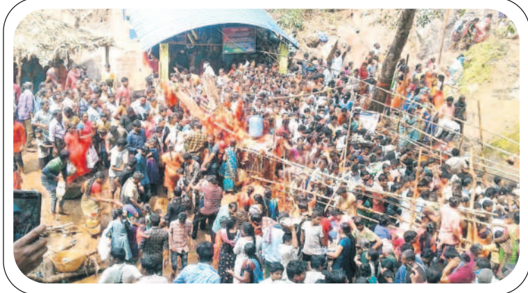
ఆలయం వద్ద కిక్కిరిసిన భక్తులు

అశ్వాసాపుడి, డిసెంబర్ 13 : తెలంగాణ- ఆంధ్ర ప్రదేశ్ రాష్ట్రాల సరిహద్దు పూర్తిగా అటవీప్రాంతంలో ఉన్న గుబ్బల మంగమ్మ ఆలయం భక్తుల కోర్కెలు తీర్చే అమ్మవారిగా ప్రసిద్ధి చెందింది. ఆలయంపై జాలువారే జలపాతం ప్రత్యేక ఆకర్షణగా నిలుస్తున్నది. ప్రకృతి సోయగాల మధ్య పచ్చని వాతావరణం భక్తులకు పారవశ్యం చేసేలా అభవదానిస్తున్నది. అమ్మవారి సేవలో కొండరెడ్డి గిరిజనులు పూజలు చేయడమే కాకుండా భక్తులకు సేవలు అందిస్తున్నారు. ప్రకృతి సిద్ధంగా స్వయంభువుగా వెలిసిన గుబ్బల మంగమ్మ తల్లి ఆలయం పర్యాటక కేంద్రంగా దినదినాభివృద్ధి చెందుతున్నది. ప్రతిపటా లక్షల మంది భక్తులు అమ్మవారిని దర్శించుకుని మొక్కులు తీర్చుకుంటున్నారు. తెలంగాణ రాష్ట్రం భద్రాద్రి కొత్తగూడెం జిల్లా అశ్వాసాపుడి పట్టణం మండలం, ఆంధ్రప్రదేశ్ రాష్ట్రం ఏలూరు జిల్లా బుట్టాయిగూడెం మండలం సరిహద్దులోని దట్టమైసల అటవీప్రాంతంలో గుబ్బల మంగమ్మ తల్లి శతాబ్దాల క్రితం స్వయంభుగా వెలిసి భక్తులకు దర్శనమిస్తున్నది. కోర్కెలు తీర్చే ఆరాధ్యదేవతగా భక్తులకు నిత్యం అమ్మవారు దర్శనమిస్తారు. తెలంగాణ, ఆంధ్రప్రదేశ్ రాష్ట్రాల వ్యాప్తంగా అమ్మవారిని దర్శించుకునేందుకు భక్తులు భారీగా తరలివస్తారు. నిత్యం దర్శనమిచ్చే అమ్మవారికి ప్రతి ఆదివారం, బుధవారం రోజు భక్తులు అధికసంఖ్యలో మొక్కులు తీర్చుకునేందుకు తరలివస్తారు.