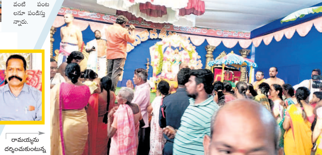
రామయ్యను పల్లకిలో తీసుకువస్తున్న ఆలయ అధికారులు, ఆర్యకులు