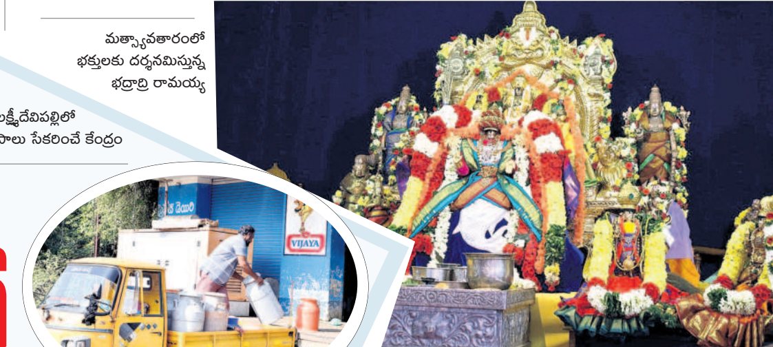
మత్స్యావతారంలో భక్తులకు దర్శనమిస్తున్న భద్రాద్రి రామయ్య