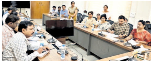
కలెక్టర్ సమీక్షలో పాల్గొన్న వివిధ శాఖల అధికారులు

వానికి ఆస్పత్రికి వచ్చిన సమయాల్లో తక్షణమే వైద్యసేవలు అందించాలని చెప్పారు. వైద్య సిబ్బంది నిర్లక్ష్యం వల్ల