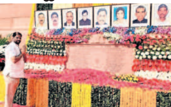
అమరవీరులకు నివాళులర్పిస్తున్న వద్దిరాజు

ఖమ్మం, డిసెంబర్ 13: పార్లమెంటుపై పాకిస్తాన్ ముప్పులు 2001లో దాడి చేసిన దుర్ఘటనలో అనువులుబాసిన అమరవీరులకు రాజ్యసభ సభ్యుడు వద్దిరాజు రవి చంద్ర బుధవారం నివాళులర్పించారు. పాకిస్తాన్ ఉగ్రవాదులు 2001లో ఇదే రోజున (డిసెంబర్ 13న) మన పార్లమెంట్ సమావేశాలు జరుగుతున్న సందర్భంలో మారణాయుధాలతో దాడి చేసింది