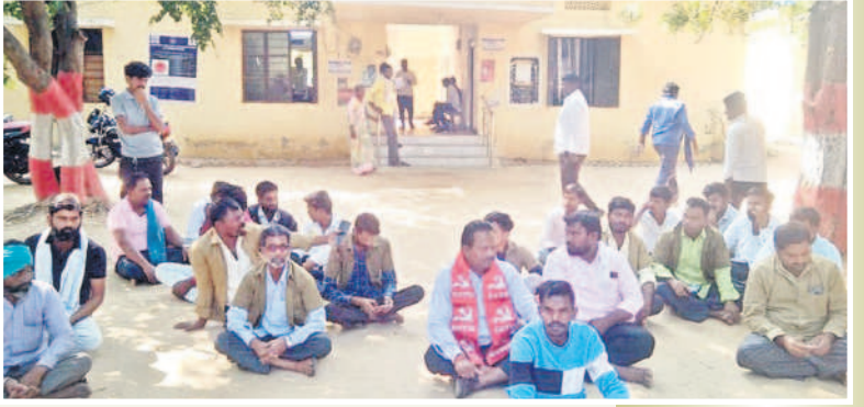
జుక్కల్ తహసీల్ కార్యాలయం ఎదుట బైరాయించిన ఆటో యూనియన్ నాయకులు