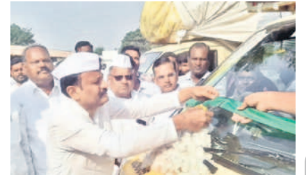
పత్తి కొనుగోళ్లను ప్రారంభిస్తున్న ఎమ్మెల్యే లక్ష్మీ కాంతారావు

మద్యూర్, డిసెంబర్ 13: మద్యూర్ లోని మార్కెట్ యార్డులో పత్తి కొనుగోళ్లను ఎమ్మెల్యే తోట లక్ష్మీ కాంతారావు బుధవారం ప్రారంభించారు. ప్రత్యేక పూజలు చేసిన అనంతరం ఆటోకు