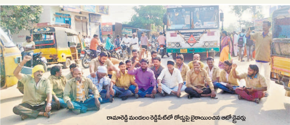
రామారెడ్డి మండలం రెడ్డిపేట్లో రోడ్డుపై బైరాయించిన ఆటో డ్రైవర్లు