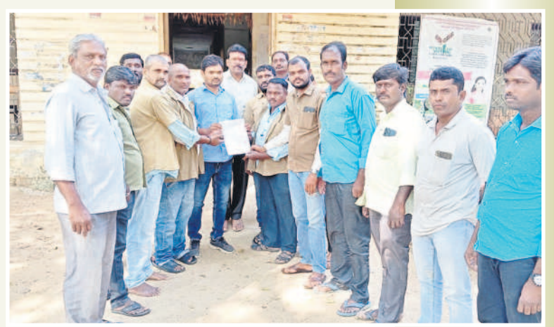
దోమకొండ తహసీల్ కార్యాలయంలో వినతిపత్రం అందజేస్తున్న ఆటోవాలలు