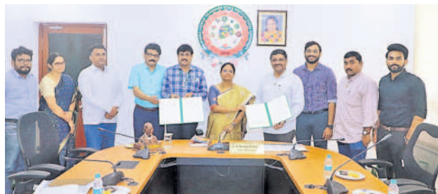
అర్బన్ కిసాన్ ఫామ్స్, కొండాలక్ష్మణ్ విశ్వవిద్యాలయం మధ్య ఒప్పందం చేసుకుంటున్న దృశ్యం

ఉద్యాన పంటలపై పరిశోధన సమాచారాన్ని పంచుకుంటాం