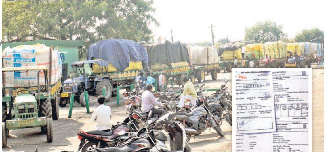
ఆదిలాబాద్ జిల్లా కేంద్రంలోని మార్కెట్ యార్డులో పత్తి వాహనాలు