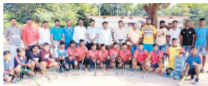
పాటిలో తలవడనున్న హాకీ జట్టు