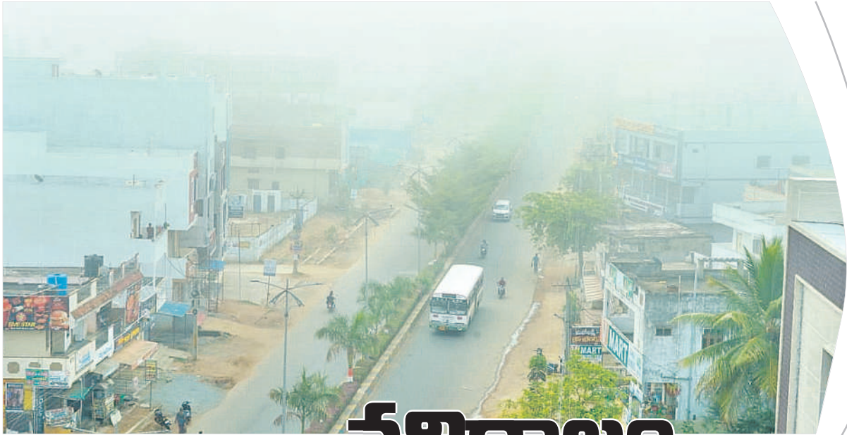
నాగర్ కర్నూల్ పట్టణంలో కమ్మకున్న పాగమండు