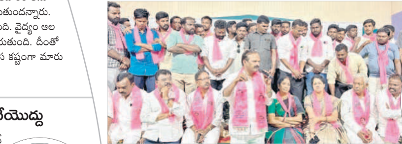
సమావేశానికి హాజరైన కార్యకర్తలు