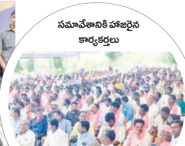
సమావేశానికి హాజరైన కార్యకర్తలు