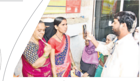
మహబూబ్ నగర్ ఈ కేవైసీ చేస్తున్న ఏజెన్సీ నిర్వాహకులు

మహబూబ్ నగర్, డిసెంబర్ 13 : మహా గ్యాస్ సిలిండర్ ధర తగ్గుతుందని, ఈ కేవైసీ చేయించుకోవాలని తెల్లవారక ముందే గ్యాస్ ఏజెన్సీ కార్యాలయాల వద్ద వినియోగదారులు బారులు తీరుతున్నారు. రాష్ట్ర ప్రభుత్వం మహిళా భరోసా పథకం కింద గ్యాస్ సిలిండర్ రూ.500లకే అందించేందుకు, ఈ కేవైసీ ఎలాంటి సంబంధం లేదని ఏజెన్సీ నిర్వాహకులు తేల్చి చెబుతున్నారు. సోషల్ మీడియాలో వస్తున్న దుర్బుధాచారాలను సమర్థవంతంగా సంబంధిత అధికారులు చెబుతున్నారు. గ్యాస్ కంపెనీలు వినియోగదారుల నుంచి వేలిముద్రలు తీసుకొని ఈ కేవైసీ చేయాలని ఆయా గ్యాస్ ఏజెన్సీల నిర్వాహకులకు ఆదేశించడం జరిగింది. ఈ విషయం సంబంధిత డివిజన్ అధికారులకు కూడా సమాచారం లేదు. కాగా, కాంగ్రెస్ ప్రభుత్వం ప్రకటించిన రూ.500ల గ్యాస్ సిలిండర్ రావాలంటే ఈ కేవైసీ చేయించుకోవాలని సోషల్ మీడియాలో పుకారా వడంతుతో వినియోగదారులంతా ఏజెన్సీ కార్యాలయాల వద్ద బారులు తీరుతున్నారు. ఈ విషయంపై సంబంధిత అధికారులు ఈ కేవైసీ ఎలాంటి తొందర లేదని, ఎప్పుడైనా చేయించుకోవచ్చని సూచిస్తున్నారు.