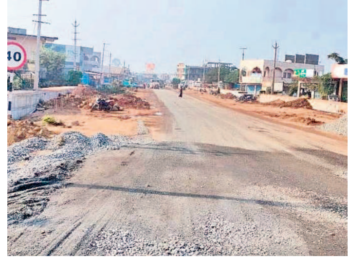
మల్లంపల్లి వద్ద అరకొరగా కొనసాగుతున్న పనులు

రూ. 350 కోట్లతో జాతీయ రహదారుల విభాగం ఆధ్వర్యంలో హనుమకొండ జిల్లా దామెర నుంచి గూడెంపాడ వరకు, నీరుకల్ల క్రాం నుంచి ములుగు జిల్లా కేంద్రంలోని గట్టమ్మ దేవాలయం వరకు ఎన్ హెచ్ 163 విస్తరణ పనులను గతేడాది ప్రారంభించారు. వీటిని దక్కించుకున్న సంబంధిత కాంట్రాక్టర్ తోలుక వేగవంతంగా పనులు చేపట్టడంతో ప్రస్తుతం అధికారుల పర్యవేక్షణ లేక నెమ్మదిగా కొనసాగుతున్నాయి. ఫోర్ లేన్ రోడ్డు నిర్మాణంతోపాటు మధ్యలో డివైడర్ ను నిర్మిస్తున్నారు. ఈ విస్తరణ పనులను చేపట్టిన కాంట్రాక్టర్ అక్కడక్కడ కల్వర్టు పనులను పూర్తి చేయలేదు. రోడ్డు నిర్మాణాన్ని కూడా మధ్య మధ్యలో పూర్తి చేశారు. ఒక లేయర్ బీటీ మాత్రమే వేశారు. మరో రెండు లేయర్ బీటీ రోడ్డు వేయాల్సి ఉంది. ములుగు జిల్లా పరిధిలో మహబూబ్ నగర్ నుంచి జాకారం వరకు కల్వర్టు నిర్మాణ పనులు ప్రారంభ దశలోనే ఉండడంతో వాహనదారులు ఇబ్బందులు పడుతున్నారు. గతంలో ఉన్న ఎన్హెచ్ రోడ్డుకు ఇరువైపులా మట్టిని, మెటల్ రోడ్డును పోయగా ప్రస్తుతం భారీ వాహనాల రాకపోకలతో దుమ్ము లేస్తున్నది. దీంతో ఇతర వాహనదారులు తీవ్ర ఇబ్బందులు పడుతున్నారు. అక్కడక్కడా మెటల్ రోడ్డు సరిగా లేక గుంతలను తలపించేలా ఉండడంతో రాత్రి వేళల్లో వాహనాలపై ప్రయాణం కొనసాగించే వాహనదారులు రోడ్డు ప్రమాదాలకు గురయ్యేలా అవకాశం ఉంది.