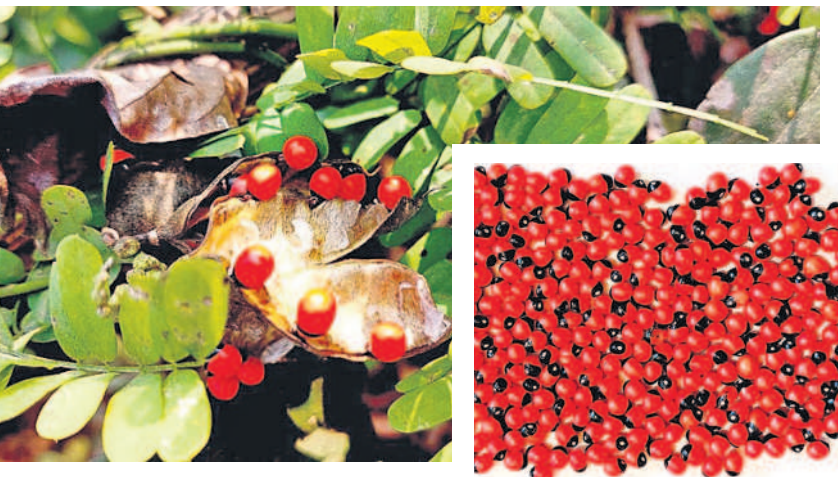
చెట్టు తీగకు కాసిన గురివింద గింజలు

- వరంగల్, డిసెంబర్ 13 (నమస్తే తెలంగాణ ప్రతినధి)