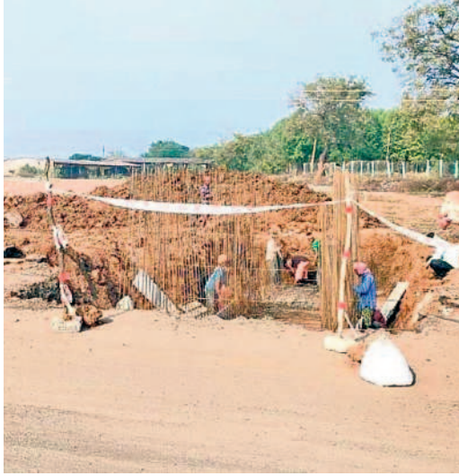
మల్లంపల్లి వద్ద ఎన్హెచ్ విస్తరణ కొనసాగుతున్న కల్వర్టు పనులు