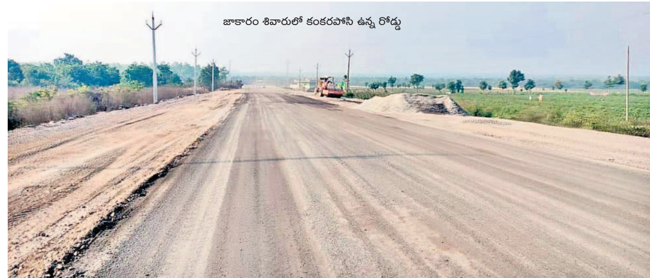
జాకారం శివారులో కంకరపానీ ఉన్న రోడ్డు

కోటి మంది భక్తుల కొంగుబంగారమైన మేడారం సమ్మక్క-సారలమ్మ జాతరను ప్రతి రెండేళ్లకొకసారి జరపడం ఆనవాయితీ. ఈ జాతరకు దేశ నలుమూలల నుంచి లక్షలాది భక్తులు తరలివస్తారు. హైదరాబాద్, హనుమకొండ వైపు నుంచి వివిధ జిల్లాలు, ప్రాంతాలు, రాష్ట్రాల నుంచి భక్తులు జాతీయ రహదారి-163 మీదుగా వస్తుంటారు. 2024 జాతరకు ఏడాది కాలంగా జరుగుతున్న ఎన్హెచ్ విస్తరణ పనులు నత్తనడకన కొనసాగుతున్నాయి. ఎప్పటికప్పుడు పర్యవేక్షించి పనులు పురోగతిని పరిశీలించాల్సిన అధికారులు అంటిముట్టనట్లు వ్యవహరిస్తున్నారు. మేడారం జాతరకు మరో 68 రోజుల గడువు మాత్రమే ఉండగా పనులు గట్టమ్మ ఆలయం వరకు పూర్తి కావాల్సి ఉండగా మల్లంపల్లి వరకే పూర్తయ్యాయి. గడువులోగా పూర్తవుతాయో లేదోనినే సంబోధించు కలుగుతోంది.