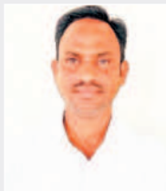
- రామకృష్ణ, ఏకావో

పూత దశలో ఉన్న కంది పంటకు తేలికపాటి తడి ఒకసారి, కాయ ఏర్పడుతున్న దశలో మరోసారి నీరు అందిస్తే దిగుబడులు పెరుగుతుంది. పచ్చపురుగు నివారణకు ఇండాక్సికార్బ్ (ఆవాంట్) ఒక మి.లీ లేదా ఫైనోసాడ్ (ట్రైసర్) అనే మందు ఒక లీటరు నీటికి మూడు మి.మీ చొప్పున పిచికారి చేయాలి. ఎండు తెగులు నివారణకు ఆశ, మారతి, పీఆర్జీ-158 వంటి రకాలను సాగు చేసుకోవాలి. వేరుశనగలో పచ్చపురుగు నివారణకు కోరిఫైరిఫాస్ 2.5 ఎంఎల్, క్విన్లోఫాస్ రెండు మి.మీ, ఎస్సెట్ ఒక గ్రాము లాంటి మందులను ఒక లీటరు నీటిలో కలిపి ఎకరాకు పిచికారి చేసుకోవాలి. కంది చేసే తడినీటిట్లు మందులు స్ట్రె చేయాలి.