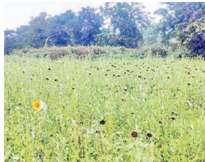
నర్సింహలపేటలో సాగు చేస్తున్న పొద్దుతిరుగుడు పంట

స్తున్నారు. వానకాలంలో సాగు చేసిన పత్తి, పెసర పంటలు చేతికొచ్చాయి. ప్రస్తుతం ఆ భూములు ఖాళీగా ఉండకుండా గతంలో పెసర, కంది, పత్తి సాగు చేయడంతో ప్రస్తుతం కంది పంట ఏపుగా పెరిగడంతో రైతులు సంతోషం వ్యక్తం చేస్తున్నారు. ప్రస్తుతం ఏ గ్రామంలో చూసినా వేరుశనగ పంట సాగు చేస్తున్నారు. నర్సింహలపేట మండలంలోని వివిధ గ్రామాల్లో 2900 హెక్టార్ల