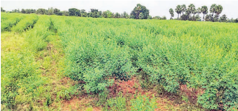
నర్సింహలపేటలో పత్తిలో అంతర పంటగా సాగు చేసిన కంది

నర్సింహలపేట, డిసెంబర్ 13 : అంతర పంటలు సాగు చేసే రైతులు ఎన్నో లాభాలు గడిస్తున్నారు. వానకాలం పత్తి, కంది పంటలు సాగు చేసిన భూముల్లో అంతర పంటగా మక్కజొన్న, వేరుశనగ సాగు చేస్తున్నారు. ఈ పంటలు ప్రస్తుతం ఏపుగా పెరిగి చేతికొస్తుండడం, దిగుబడి ఎక్కువగా ఉండడంతో రైతులు ఆ దిశగా అడుగులు వేస్తున్నారు. నీరు, ఖర్చు, శ్రమ కూడా తక్కువగా ఉండడంతో ఇప్పుడు ఏ గ్రామంలో చూసినా కంది, వేరుశనగ పంటలు ఎక్కువ శాతం కనిపిస్తున్నాయి. మండలాల్లోని ఆయా గ్రామాల్లోని రైతులు అంతర పంటల వైపు రాబో