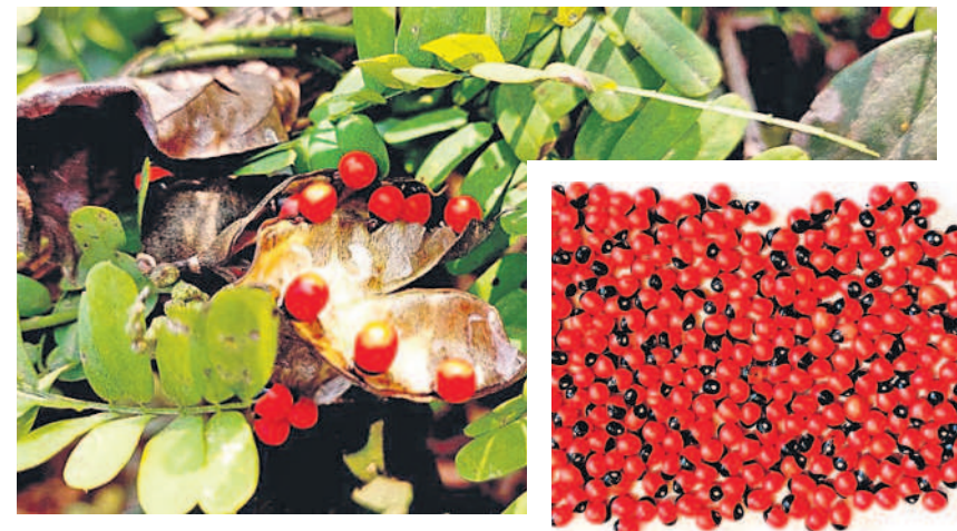
చెట్టు తీగకు కాసిన గురివింద గింజలు

- వరంగల్, డిసెంబర్ 13 (నమస్తే తెలంగాణ ప్రతినధి)