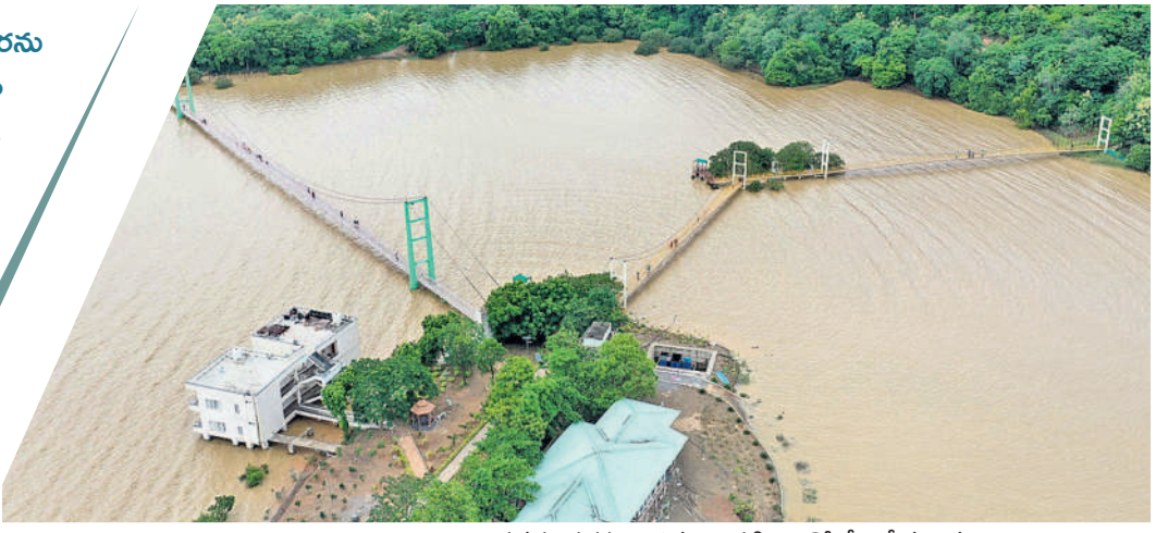
లక్కవరం సరస్సుపై ఉన్న మొదటి, రెండో వేలాడే వంతెనలు

కోటి మంది భక్తుల కొంగుబంగారమైన మేడారం సమ్మక్క-సారలమ్మ జాతరను ప్రతి రెండేళ్లకొకసారి జరపడం ఆనవాయితీ. ఈ జాతరకు దేశ నలుమూలల నుంచి లక్షలాది భక్తులు తరలివస్తారు. హైదరాబాద్, హనుమకొండ వైపు నుంచి వివిధ జిల్లాలు, ప్రాంతాలు, రాష్ట్రాల నుంచి భక్తులు జాతీయ రహదారి-163 మీదుగా వస్తుంటారు. 2024 జాతరకు ఏడాది కాలంగా జరుగుతున్న ఎన్హెచ్ విస్తరణ పనులు నత్తనడకన కొనసాగుతున్నాయి. ఎప్పటికప్పుడు పర్యవేక్షించి పనులు పురోగతిని పరిశీలించాల్సిన అధికారులు అంటిముట్టనట్లు వ్యవహరిస్తున్నారు. మేడారం జాతరకు మరో 68 రోజుల గడువు మాత్రమే ఉండగా పనులు గట్టమ్మ ఆలయం వరకు పూర్తి కావాల్సి ఉండగా మల్లంపల్లి వరకే పూర్తయ్యాయి. గడువులోగా పూర్తవుతాయో లేదోనినే సంబోధించు కలుగుతోంది.