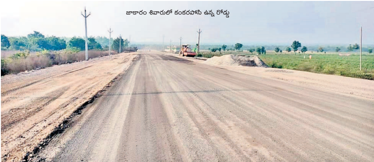
జాకారం శివారులో కంకరపానీ ఉన్న రోడ్డు

కోటి మంది భక్తుల కొంగుబంగారమైన మేడారం సమ్మక్క-సారలమ్మ జాతరను ప్రతి రెండేళ్లకొకసారి జరపడం ఆనవాయితీ. ఈ జాతరకు దేశ నలుమూలల నుంచి లక్షలాది భక్తులు తరలివస్తారు. హైదరాబాద్, హనుమకొండ వైపు నుంచి వివిధ జిల్లాలు, ప్రాంతాలు, రాష్ట్రాల నుంచి భక్తులు జాతీయ రహదారి-163 మీదుగా వస్తుంటారు. 2024 జాతరకు ఏడాది కాలంగా జరుగుతున్న ఎన్హెచ్ విస్తరణ పనులు నత్తనడకన కొనసాగుతున్నాయి. ఎప్పటికప్పుడు పర్యవేక్షించి పనులు పురోగతిని పరిశీలించాల్సిన అధికారులు అంటిముట్టనట్లు వ్యవహరిస్తున్నారు. మేడారం జాతరకు మరో 68 రోజుల గడువు మాత్రమే ఉండగా పనులు గట్టమ్మ ఆలయం వరకు పూర్తి కావాల్సి ఉండగా మల్లంపల్లి వరకే పూర్తయ్యాయి. గడువులోగా పూర్తవుతాయో లేదోనినే సంబోధించు కలుగుతోంది.