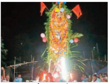
ప్రభపై ఊరేగుతున్న ఆంజనేయస్వామి

వరాహాంజనేయస్వామి బ్రహ్మోత్స ವಾಲ್ಟ್ ಭಾಗಂಗಾ ಗುರುವಾರಂ ಅಂತ ర్రాష్ట్ర బండలాగుడు పోటీలు నిర్వహిం చనున్నట్లు నిర్వాహకులు తెలిపారు. పోటీలకు తెలంగాణ, ఆంధ్రా, కర్హాటక రాష్ట్రాల నుంచి ఎద్దులు తరలిరాను న్నట్లు వారు తెలిపారు.