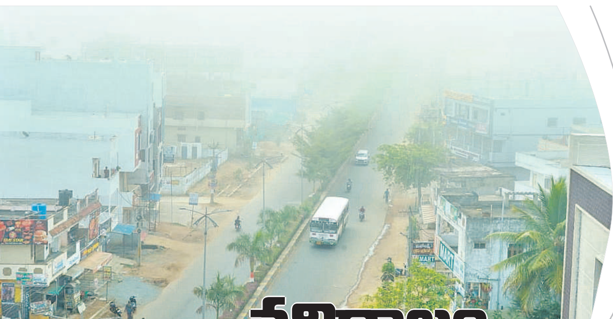
నాగర్ కర్నూల్ పట్టణంలో కమ్మకున్న పాగముండు