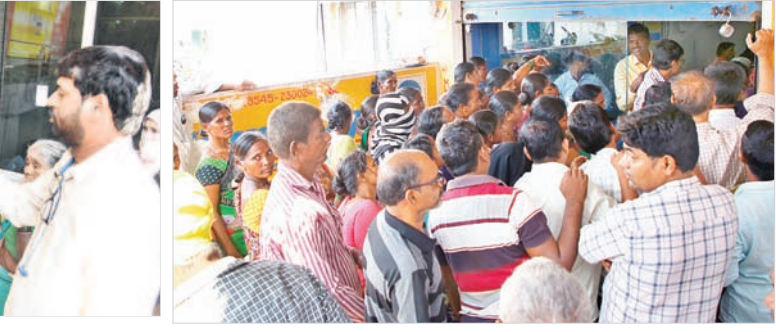
మహబూబ్ నగర్ ఈ కేవైసీ చేస్తున్న ఏజెన్సీ నిర్వాహకులు

మహబూబ్ నగర్, డిసెంబర్ 13 : చంటి గ్యాస్ సిలిండర్ ధర తగ్గుతుందని, ఈ కేవైసీ చేయించుకోవాలని తెల్లవారక ముందే గ్యాస్ ఏజెన్సీ కార్యాలయాల వద్ద వినియోగదారులు బారులు తీరుతున్నారు. రాష్ట్ర ప్రభుత్వం మహిళా భరోసా పథకం కింద గ్యాస్ సిలిండర్ రూ.500లకే అందించేందుకు, ఈ కేవైసీ ఎలాంటి సంబంధం లేదని ఏజెన్సీ నిర్వాహకులు తేల్చి చెబుతున్నారు. సోషల్ మీడియాలో వస్తున్న దుర్భ్రాచారాలను నమ్మవద్దని సంబంధిత అధికారులు చెబుతున్నారు. గ్యాస్ కంపెనీలు వినియోగదారుల నుంచి వేలిముద్రలు తీసుకొని ఈ కేవైసీ చేయాలని ఆయా గ్యాస్ ఏజెన్సీల నిర్వాహకులకు ఆదేశించడం జరిగింది. ఈ విషయం సంబంధిత డివిజన్ అధికారులకు కూడా సమాచారం లేదు. కాగా, కాంగ్రెస్ ప్రభుత్వం ప్రకటించిన రూ.500ల గ్యాస్ సిలిండర్ రావాలంటే ఈ కేవైసీ చేయించుకోవాలని సోషల్ మీడియాలో పుకారా వాడడంతో వినియోగదారులంతా ఏజెన్సీ కార్యాలయాల వద్ద బారులుతీరుతున్నారు. ఈ విషయంపై సంబంధిత అధికారులు ఈ కేవైసీ ఎలాంటి తొందర లేదని, ఎప్పుడైనా చేయించుకోవచ్చని సూచిస్తున్నారు.