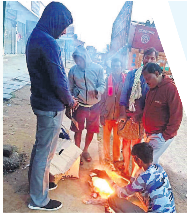
అర్చనల్లో చలిమంట వేసుకుంటున్న ప్రజలు