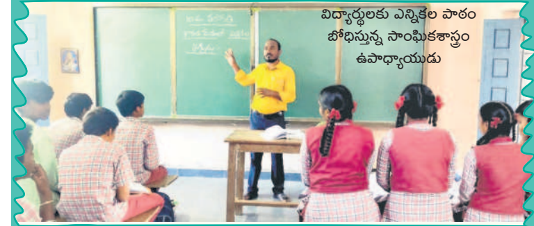
విద్యార్థులకు ఎన్నికల పాఠం బోధిస్తున్న సాంఘికశాస్త్రం ఉపాధ్యాయుడు

సూక్ష్మ నెట్ వర్క్, డిసెంబర్ 13 : విద్యార్థుల దళ లోనే ప్రజాస్వామ్యం, ఓటు హక్కు విలువను తెలియజేసేందుకు ప్రభుత్వం పదో తరగతి సాంఘిక శాస్త్రంలో 'భారతదేశంలో ఎన్నికల ప్రక్రియ' పాఠ్యాంశాన్ని ప్రవేశపెట్టింది. ఈ ఎన్నికల సమయంలోనే పాఠ్యాంశం సిలబస్ లో ఉండడం