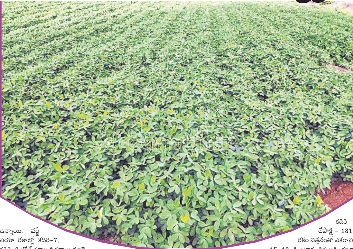
ఉన్నాయి. వర్జీనియా రకాల్లో కదిరి-7, కదిరి-8 బోర్న్ రకాల విత్తనాలు మార్కెట్ లో అందుబాటులో ఉన్నాయి. ఇసుకతో కూడిన గరువ నేలలు, నీరు తగ్గగా ఇంకా ఎర్ర చెల్లె నేలలు

యాసంగి సీజన్ లో పల్లి సాగుకు మొదట నాణ్యమైన విత్తన రకాలను రైతులు ఎంచుకోవాలి. ఇందులో స్పానిష్ గుత్తి, వర్జీనియా గుత్తి అనే రెండు రకాలుంటాయి. స్పానిష్ రకాల్లో కదిరి-6, కదిరి-9, అనంత, కదిరి హరితాంధ్ర, ఐసీజీవి-91114 ధరణి, టీఎన్ 24 రకాల విత్తనాలు