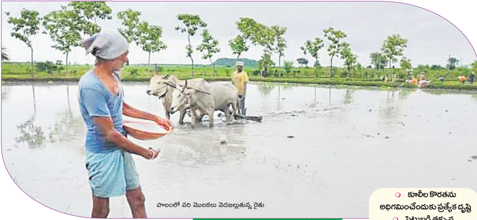
పాలంలో వరి మొలకలు వెదజల్లుతున్న రైతు