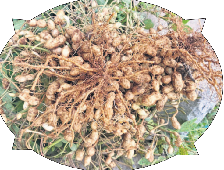
కదిరి లేపాక్షి - 1812 రకం విత్తనంతో ఎకరానికి 15-18 క్వింటాళ్ళ దిగుబడి కూడా వస్తున్నట్లు వ్యవసాయాధికారులు చెబుతున్నారు.

పల్లి విత్తన రకాలను బట్టి దిగుబడులు వస్తాయని వ్యవసాయాధికారులు చెబుతున్నారు. కదిరి-6 విత్తన రకంలో యాసంగిలో ఎకరాకు 12 నుంచి 14 క్వింటాళ్ళ దిగుబడి వచ్చే అవకాశం ఉంది. కదిరి-9 విత్తనం సాగుచేస్తే ఎకరాకు 10-12 క్వింటాళ్ళు, కదిరి హరితాంధ్రతో 10-12, ధరణి ద్వారా 9-10, టీఎన్-24 ద్వారా 8-10, టిఎల్-24 ద్వారా 10-11, ఐసీజీవి-91114 ద్వారా 10-12, కదిరి 7, 8 ద్వారా 12-14 క్వింటాళ్ళ దిగుబడి వస్తుందని వ్యవసాయాధికారులు పేర్కొంటున్నారు. ఇటీవల కొత్తగా వచ్చిన