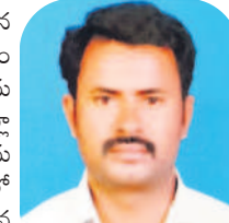
-రఘు, ఉత్తమ్, ఇబ్రహీంపట్నం

వెదజల్లడం రైతుకు చాలా తేలికైన పని. ఎటువంటి సాంకేతిక పరిజ్ఞానం అవసరం లేకుండానే వరి విత్తనాలను జల్లుకోవచ్చు. అన్ని విధానాల్లోకెల్లా ఇదే ఉత్తమమైన విధానం. మంచి అనుభవం ఉన్న వ్యక్తితో జల్లిస్తే మడిలో సమానంగా వరి విత్తనాలు పడి ఎక్కువ పీలకలు పెడుతుంది. వెదజల్లిన దగ్గర నుంచి ఎరువులు, మందులు కావల్సిన మోతాదులో సరైన సమయంలో అందిస్తే ఆశించిన దిగుబడి వస్తుంది. మా క్లస్టర్ పరిధిలో గతంలో పది మంది రైతులతో వెదజల్లే విధానం సాగు చేయించాను. ఈసారి కూడా మరింతమందికి అవగాహన కల్పించి వెదజల్లే విధానం వైపు రైతుల దృష్టి మరలించేందుకు కృషిచేస్తున్నాం.