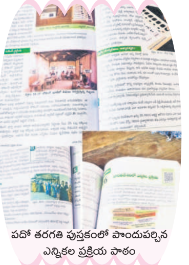
పదో తరగతి పుస్తకంలో పొందుపర్చిన ఎన్నికల ప్రక్రియ పాఠం