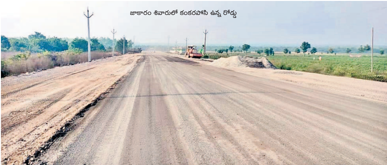
జాకారం శివారులో కంకరపానీ ఉన్న రోడ్డు

కోటి మంది భక్తుల కొంగుబంగారమైన మేడారం సమ్మక్క-సారలమ్మ జాతరను ప్రతి రెండేళ్లకొకసారి జరపడం ఆనవాయితీ. ఈ జాతరకు దేశ నలుమూలల నుంచి లక్షలాది భక్తులు తరలివస్తారు. హైదరాబాద్, హనుమకొండ వైపు నుంచి వివిధ జిల్లాలు, ప్రాంతాలు, రాష్ట్రాల నుంచి భక్తులు జాతీయ రహదారి-163 మీదుగా వస్తుంటారు. 2024 జాతరకు ఏడాది కాలంగా జరుగుతున్న ఎన్హెచ్ విస్తరణ పనులు నత్తనడకన కొనసాగుతున్నాయి. ఎప్పటికప్పుడు పర్యవేక్షించి పనులు పురోగతిని పరిశీలించాల్సిన అధికారులు అంటిముట్టనట్లు వ్యవహరిస్తున్నారు. మేడారం జాతరకు మరో 68 రోజుల గడువు మాత్రమే ఉండగా పనులు గట్టమ్మ ఆలయం వరకు పూర్తి కావాల్సి ఉండగా మల్లంపల్లి వరకే పూర్తయ్యాయి. గడువులోగా పూర్తవుతాయో లేదోనినే సంబోధించు కలుగుతోంది.