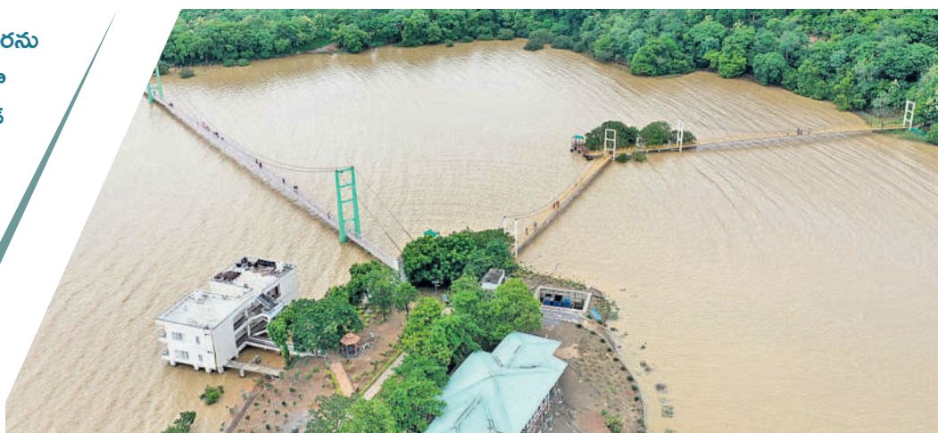
లక్కవరం సరస్సుపై ఉన్న మొదటి, రెండో వేలాడే వంతెనలు