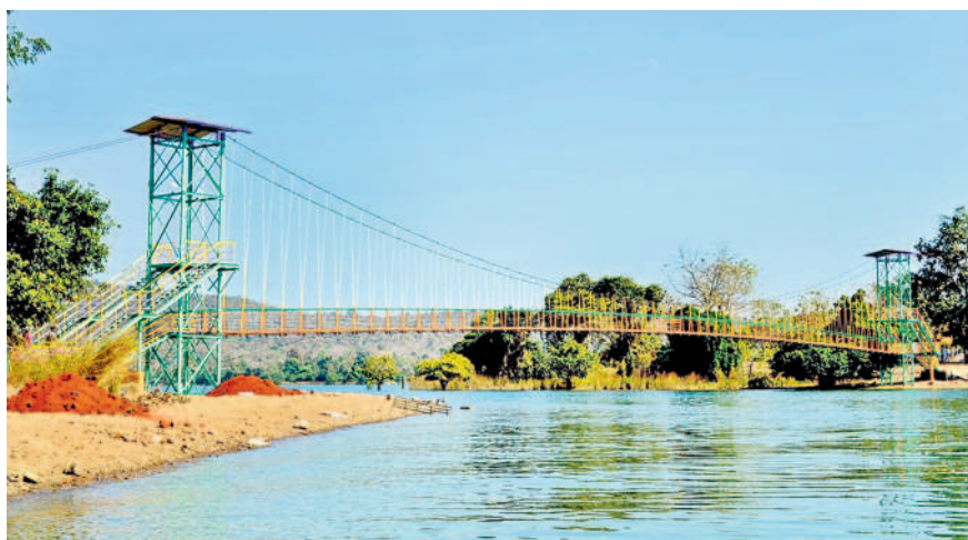
లక్కవరం సరస్సుపై ఏర్పాటు చేసిన మూడో వంతెన