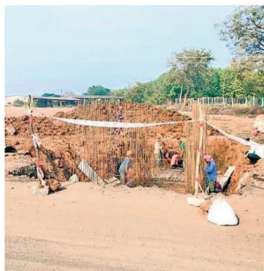
మల్లంపల్లి వద్ద ఎన్హెచ్ విస్తరణ కొనసాగుతున్న కల్వర్టు పనులు