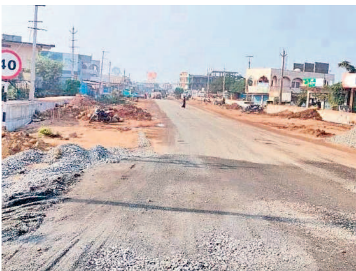
మల్లంపల్లి వద్ద అరకొరగా కొనసాగుతున్న పనులు

రూ. 350 కోట్లతో జాతీయ రహదారుల విభాగం ఆధ్వర్యంలో హనుమకొండ జిల్లా దామెర నుంచి గూడెం వరకు, నీరుకుక్క క్రాం నుంచి ములుగు జిల్లా కేంద్రంలోని గట్టమ్మ దేవాలయం వరకు ఎన్ హెచ్ 163 విస్తరణ పనులను గతేడాది ప్రారంభించారు. వీటిని దక్కించుకున్న సంబంధిత కాంట్రాక్టర్ తోలుక వేగవంతంగా పనులు చేపట్టడంతో ప్రస్తుతం అధికారుల పర్యవేక్షణ లేక నెమ్మదిగా కొనసాగుతున్నాయి. ఫోర్ లేన్ రోడ్డు నిర్మాణంతోపాటు మధ్యలో డివైజర్ ను నిర్మిస్తున్నారు. ఈ విస్తరణ పనులను చేపట్టిన కాంట్రాక్టర్ అక్కడక్కడ కల్వర్టు పనులను పూర్తి చేయలేదు. రోడ్డు నిర్మాణాన్ని కూడా మధ్య మధ్యలో పూర్తి చేశారు. ఒక లేయర్ బీటీ మాత్రమే వేశారు. మరో రెండు లేయర్ బీటీ రోడ్డు వేయాల్సి ఉంది. ములుగు జిల్లా పరిధిలో మహాద్ గోస్పల్లి నుంచి జాకారం వరకు కల్వర్టు నిర్మాణ పనులు ప్రారంభ దశలోనే ఉండడంతో వాహనదారులు ఇబ్బందులు పడుతున్నారు. గతంలో ఉన్న ఎన్హెచ్ రోడ్డుకు ఇరువైపులా మట్టిని, మెటల్ రోడ్డును పోయగా ప్రస్తుతం భారీ వాహనాల రాకపోకలతో దుమ్ము లేస్తున్నది. దీంతో ఇతర వాహనదారులు తీవ్ర ఇబ్బందులు పడుతున్నారు. అక్కడక్కడా మెటల్ రోడ్డు సరిగా లేక గుంతలను తలపించేలా ఉండడంతో రాత్రి వేళల్లో వాహనాలపై ప్రయాణం కొనసాగించే వాహనదారులు రోడ్డు ప్రమాదాలకు గురయ్యేలా అవకాశం ఉంది.