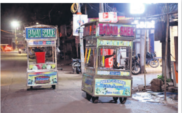
రాత్రి 10.40 గంటలు... మార్కెట్ రోడ్డులో జ్యూస్ బండ్లు