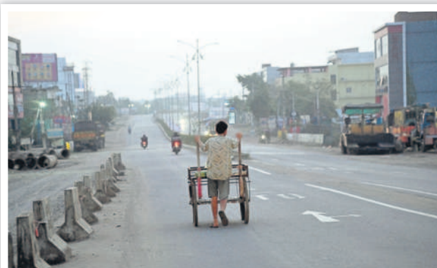
ఉదయం 6.01 గంటలు... తెల్లవారుజామున హైవే రోడ్డు