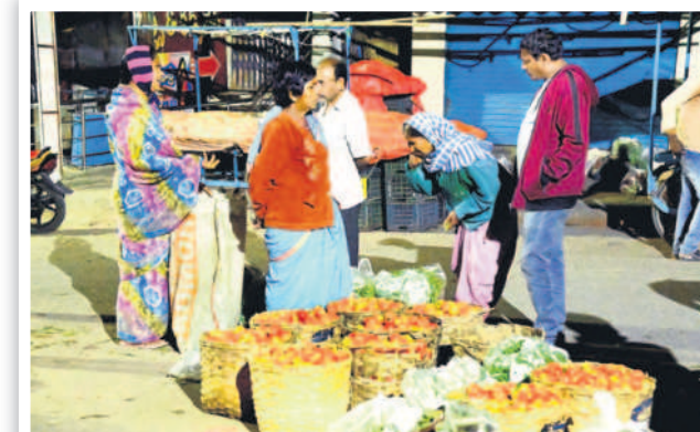
ఉదయం 4.06 గంటలు... కురగాయలు కొనుగోలు చేస్తున్న వ్యాపారులు