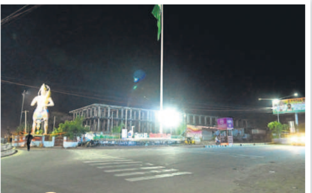
రాత్రి 11.15 గంటలు... నిర్మాణవ్యయంగా ఉన్న ఐటీ చౌరస్తా