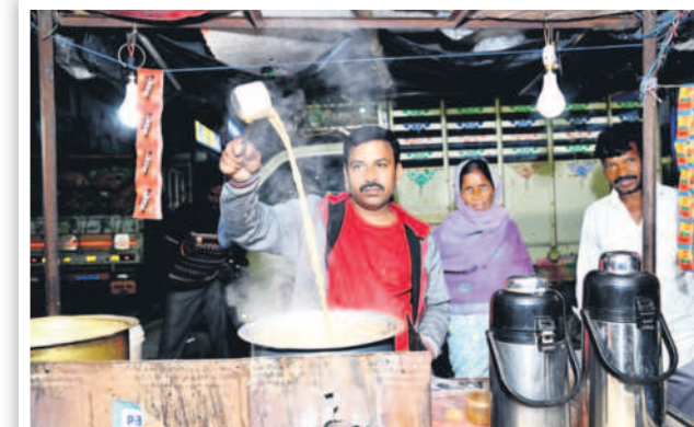
ఉదయం 4.20 గంటలు... మార్కెట్లో టీ చేస్తూ...