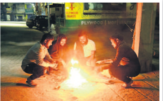
అర్ధరాత్రి 1.03 గంటలు... చలి కాగుతున్న యువకులు