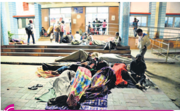
రాత్రి 10.15 గంటలు... మంచిర్యాల రైల్వే స్టేషన్ ఎదుట నిర్లిప్తున్న ప్రయాణికులు