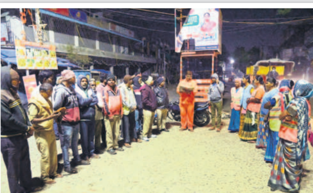
ఉదయం 4.50 గంటలు... మున్సిపల్ కార్మికుల హాజరు తీసుకుంటున్న జవాన్