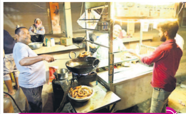
రాత్రి 10.30 గంటలు... మార్కెట్ రోడ్డులో మిర్చి వేస్తున్న దుకాణదారు