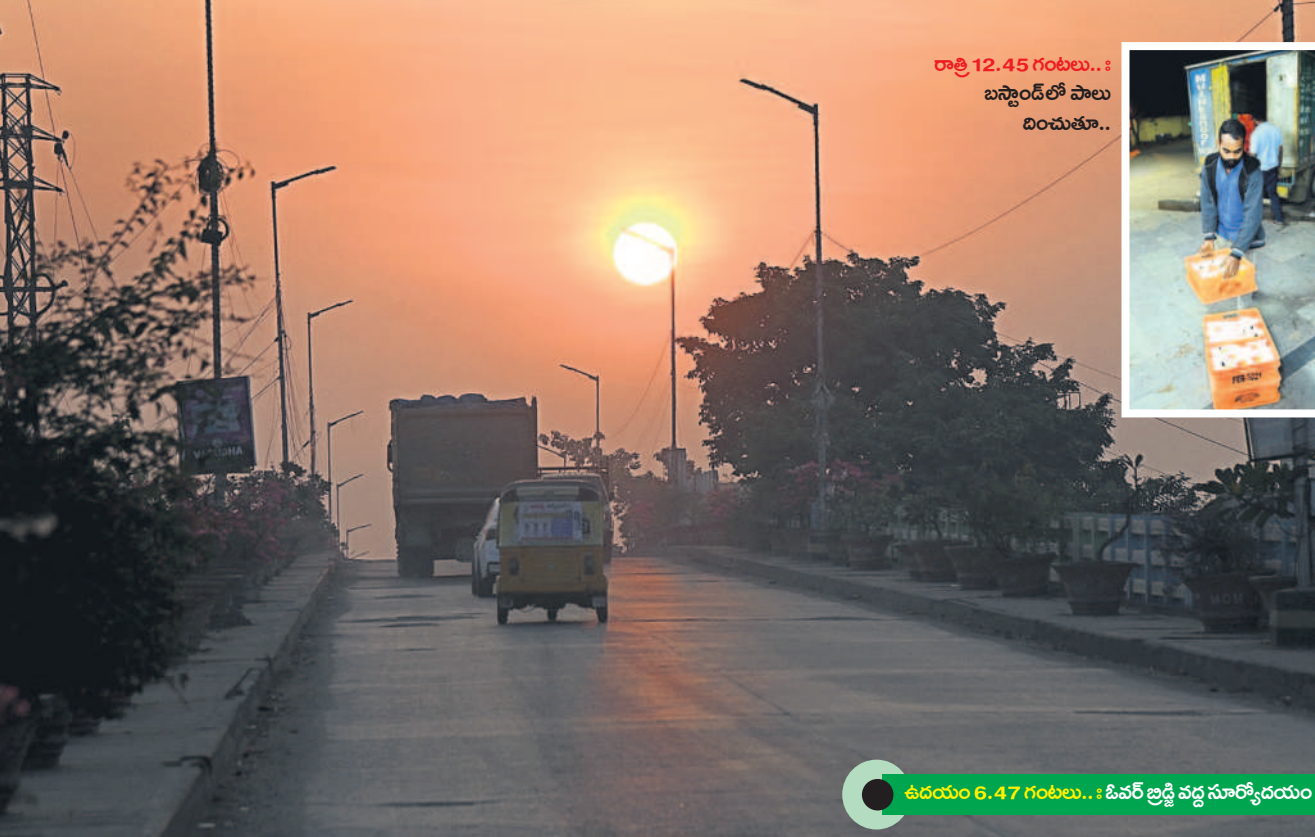
రాత్రి 12.45 గంటలు... బస్టాండ్లో పాలు దించుతూ...