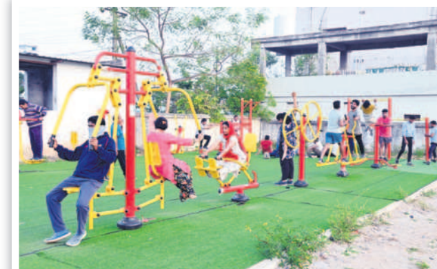
ఉదయం 6.15 గంటలు... కాలేజీ రోడ్డులో ఏ బిపెన్ జిమ్