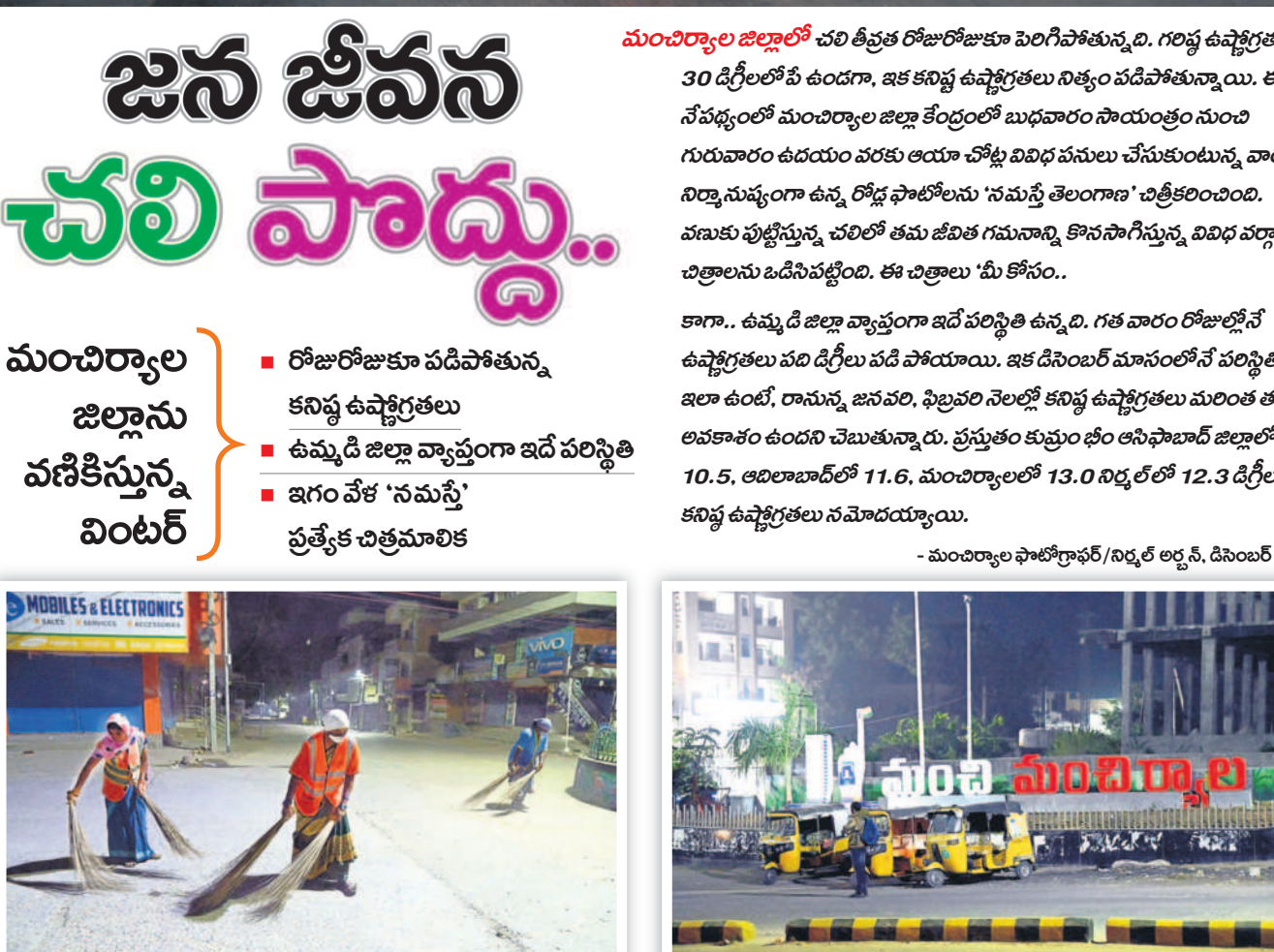
ఉదయం 5.05 గంటలు... బర్నియాలలో వీధులు శుభ్రం చేస్తూ...