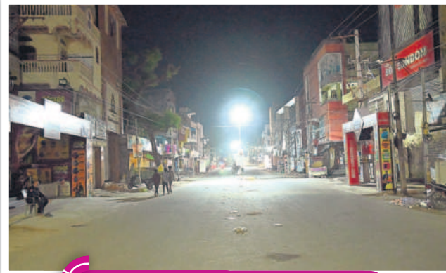
రాత్రి 10.25 గంటలు... నిర్మాణవ్యయంగా మార్కెట్ రోడ్డు