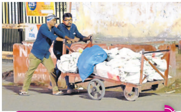
రాత్రి 10.21 గంటలు... పోస్టాఫీసుకు పార్కర్లను తీసుకెళ్తున్న సిబ్బంది