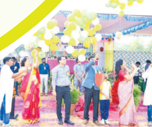
బెల్లూస్ గాలిలో ఎర్రవేస్తున్న కలెక్టర్