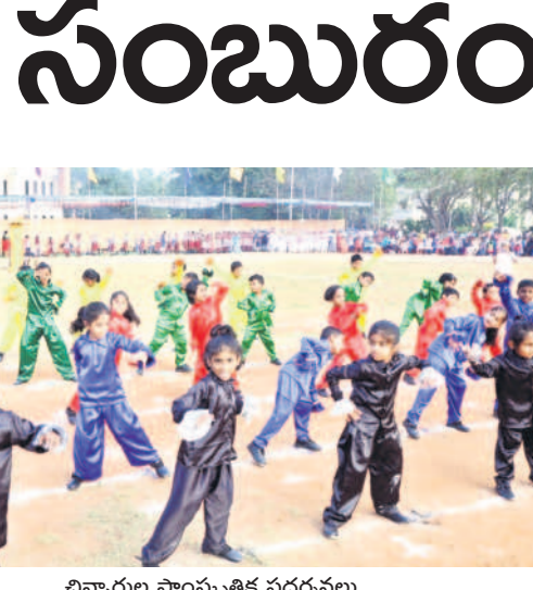
బిన్నారుల సాంస్కృతిక ప్రదర్శనలు

20వ తేదీ నుంచి దరఖాస్తుల స్వీకరణ జనవరి ఒకటో తేదీ వరకు 18 ఏళ్లు నిండిన యువతీ యువకులు అర్హుల సవరణలు, మార్పులు, చేర్పులకు అవకాశం కల్పించిన ఎన్నికల సంఘం