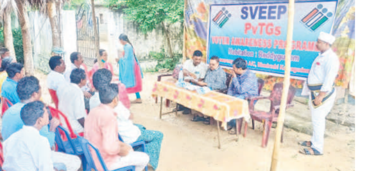
అసెంబ్లీ ఎన్నికల సమయంలో ఓటు హక్కుపై అవగాహన కల్పిస్తున్న అధికారులు(ఫైల్)