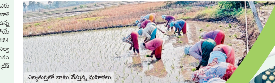
ఎల్లూతుర్తిలో నాటు వేస్తున్న మహిళలు

హనుమకొండ నబర్నన్, డిసెంబర్ 14 : జిల్లాలో యానంగి సాగు పనులు ఇప్పుడే జోరందుకుంటున్నాయి. ఓవైపు ఇంకా పరిశోధన కొనసాగుతున్నా మరోవైపు పరినాట్లు మొదలయ్యాయి. ఈ సారి కూడా పరిని ప్రధాన పంటగా వ్యవసాయ ఆధికారులు అంచనా వేశారు. రెండో ప్రధాన పంటగా మొక్కజొన్న వైపు రైతులు మొగ్గు చూపుతున్నారు. ఈసారి వర్షాలు తక్కువే వడినా ఒకేసారి కరిసిన భారీ వర్షాలతో అన్ని చెరువులూ పూర్తి స్థాయిలో నిండి కళకళలాడుతున్నాయి. దీనితో వ్యవసాయానికి ప్రధాన అయివుపట్టుగా ఉన్న ఎస్సార్సెన్సి, దేవాదుల ప్రాజెక్టుల వీళ్ళ అందుబాటులో ఉన్నాయి. భూగర్భ జలాలు కూడా పుష్కలంగా ఉండడంతో బావులు, బోర్ల ద్వారా వచ్చే నీటితో రైతులు యానంగి పంటకు సరిపడా సాగునీరు అందనుంది. హనుమకొండ జిల్లాలోని ఎల్లూతుర్తి, కమలాపూర్, హనువపర్తి, దామెర, భీమదేవరపల్లి, వేలేడు, ధర్మసాగర్, ఐనవోలు, హనుమకొండ, నడికూడ మంలా లాల్లో పరి కోతలు పూర్తయి నాల్గో పోషకుని పొలాలూ దున్నే పనిలో ఉన్నారు. ముందస్తుగా నారు పోషకున్న రైతులు ఏకంగా నాట్లు వేస్తున్నారు. ఇతర వరకాల, కాయంపేట, అత్త కూర మండలాల్లో ఇంకా పరి కోతలు, దాన్యం తరలింపు పంటి పనులు కొనసాగుతున్నాయి. పత్తి వేస్తు పూర్తి చేసిన రైతులు మళ్ళీ పంటను కూడా వేస్తున్నారు. మరోవైపు ఇతర పప్పు దినుసుల పంటలను కూడా వేసుకుంటున్నారు.