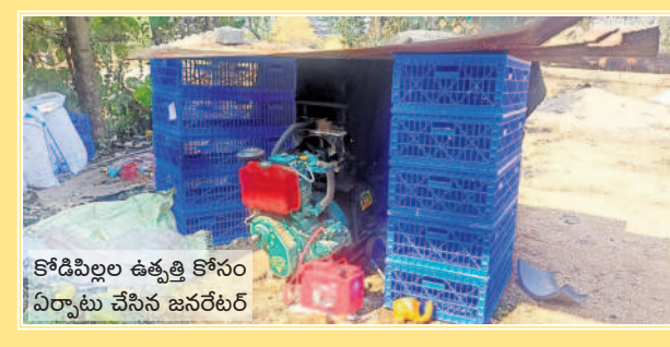
కోడిపిల్లల ఉత్పత్తి కోసం ఏర్పాటు చేసిన జనరేటర్