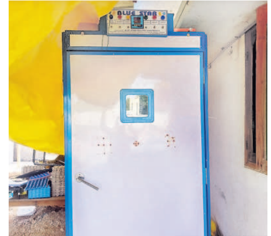
కోడిగుడ్డును కూల్లో ఉంచేందుకు ఏర్పాటు చేసిన యంత్రం