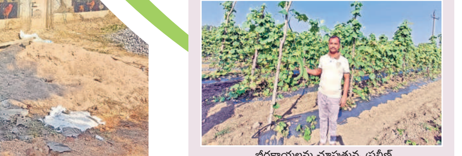
బీరకాయలను చూపుతున్న ప్రవీణ్