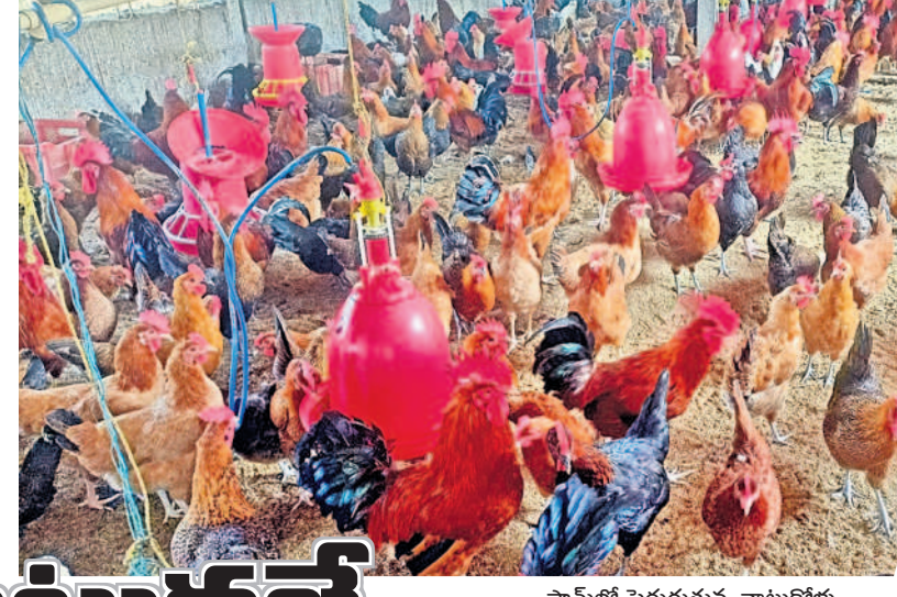
ఫామ్లో పెరుగుతున్న నాటుకోళ్ళు