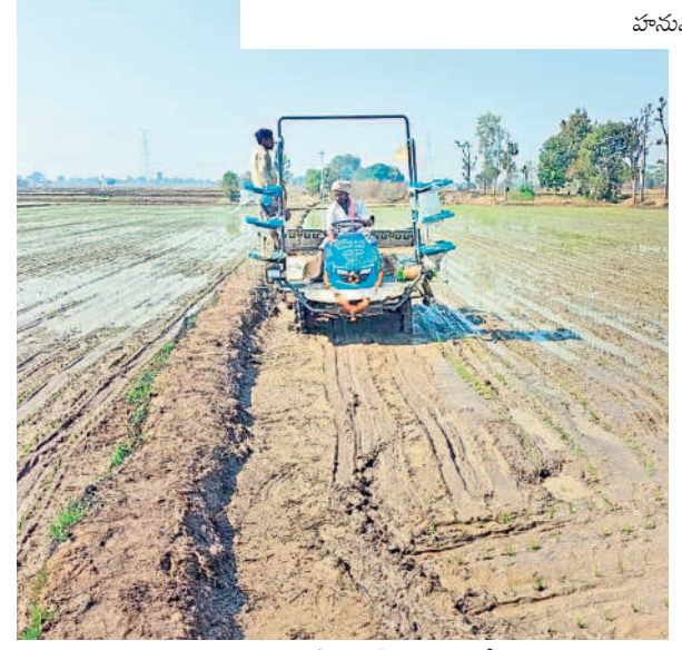
కమలాపూర్ మండలంలో మిషిన్తో నాటు వేస్తున్న రైతు

ఎరువులకు కరువు లేదు యానంగి పంట సాగుకు సంబంధించి ఎరువుల విషయంలో ఎలాంటి జోకా లేకుండా గత ప్రభుత్వమే చర్యలు తీసుకున్నది. అవసరాలకు మించి ఎరువులు తెలంగాణ రాష్ట్ర మార్కెట్ వద్ద నిల్వలు ఉన్నాయి. ముందస్తు ప్రణాళికతో అన్ని రకాల ఎరువులను గోదాముల్లో నిల్వ ఉంచారు. ప్రస్తుతం ఉన్న నిల్వలు యానంగి సాగు కోసం ఉమ్మడి వరంగల్ జిల్లా మొత్తానికి సరిపోయే స్థాయిలో నిల్వ ఉంచారు. యూరియా 7006 మెట్రిక్ టన్నులు, డీపీ 424 మెట్రిక్ టన్నులు, ఇతర కాంప్లెక్స్ ఎరువులు 310 మెట్రిక్ టన్నులు నిల్వ ఉన్నాయి. పంట దిగుబడిలో అత్యంత ప్రాముఖ్యత ఉండే పోటాషను సైకం అందుబాటులో ఉంచారు. జిల్లాలో మొత్తంగా చూస్తే 7741.405 మెట్రిక్ టన్నుల ఎరువులు బఫర్ నిల్వలగా అందుబాటులో ఉన్నాయి.