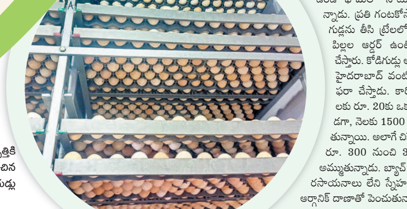
పిల్లల ఉత్పత్తికి యంత్రంలో ఉంచిన కోడిగుడ్డు