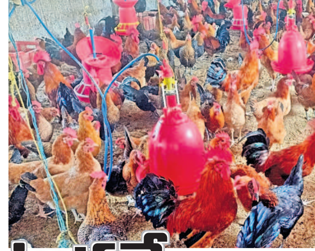
ఫామ్లో పెరుగుతున్న నాటుకోళ్లు