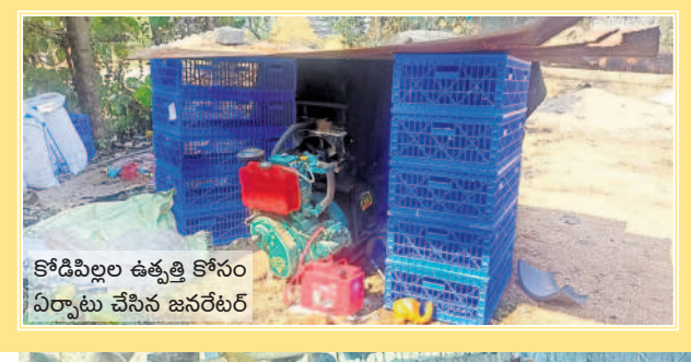
కోడిపిల్లల ఉత్పత్తి కోసం ఏర్పాటు చేసిన జనరటర్