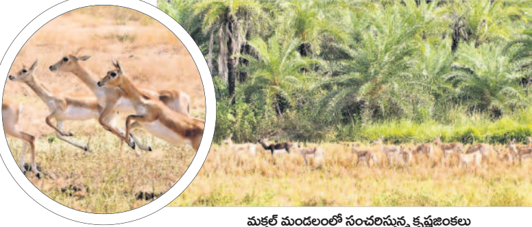
మక్కల్ మండలంలో సంపత్స్వన్న కృష్ణజంకులు