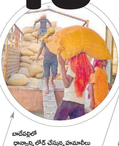
బాదేపల్లిలో ధాన్యాన్ని లోడ్ చేస్తున్న హమాలీలు

మంచి ధరలు వస్తున్నాయి. బీఆర్ఎస్ ప్రభుత్వ హయాంలో సన్నాలను సాగుచేయాలని రైతులకు సూచించడం జరిగింది. దాంతోఅప్పటి నుంచి రైతులు అధికంగా సన్నరకాలను సాగుచేస్తున్నారు. అయితే యాసంగిలో ఎక్కువగా ఉండటంతో వచ్చే సీజన్‌ను కూడా దృష్టిలో ఉంచుకొని వ్యాపారులు సన్నరకాలకు ధరలు అధికంగా వేసి కొనుగోలు చేస్తున్నారు. ఈ ఏడాది వానాకాలంలో లక్షా 90వేల ఎకరాల్లో పరిసాగు చేశారు. గతేడాది వానాకాలంలో లక్షా 80వేల ఎకరాల్లో సాగుచేశారు. ఎకరాకు దాదాపుగా 40 నుంచి 45బస్తాల దిగుబడి వస్తున్నది. జిల్లాలో దాదాపు 9లక్షల 90వేల