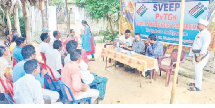
అసెంబ్లీ ఎన్నికల సమయంలో ఓటు హక్కుపై అవగాహన కల్పిస్తున్న అధికారులు(ఫైల్)