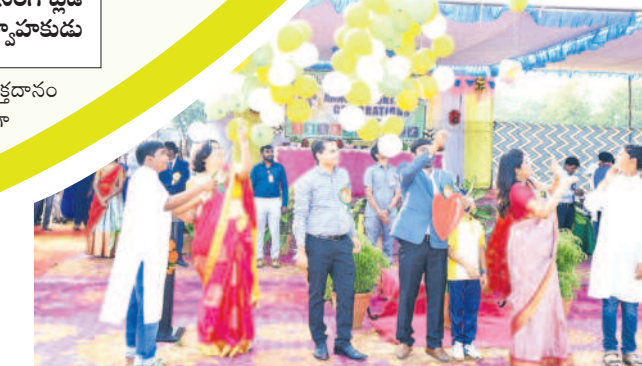
బెల్గానూరు గాలిలో ఎర్రవేస్తున్న కలెక్టర్