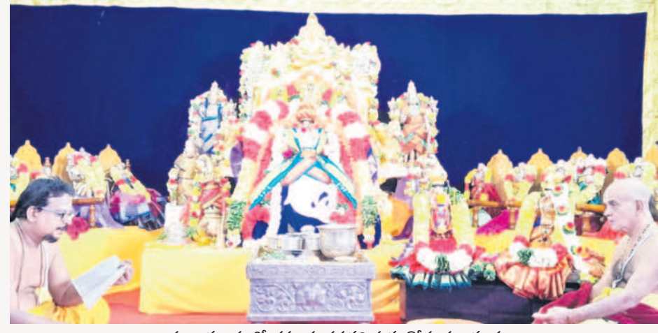
కూర్మావతారంలో భక్తులకు దర్శనమిస్తున్న కోదండ రాముడు

భద్రాచలం, డిసెంబర్ 14 : భద్రాచలం సీతారామచంద్రస్వామి దివ్యక్షేత్రంలో దేవస్థానం అధ్యక్షంలో నిర్వహిస్తున్న ముక్కోటి ఏకాదశి అర్చనలు వైభవంగా కొనసాగుతున్నాయి. గురువారం రెండో రోజు భద్రాద్రి రామయ్య కూర్మావతారంలో భక్తులకు దర్శనమిస్తున్నాడు. స్వామివారిని చూసి మురిసిపోయారు. ఉదయం స్వామివారి నిత్య కల్యాణ మూర్తులు, ఉత్తమ మూర్తులను జేదా మండపానికి తీసుకొచ్చి ప్రత్యేక అభిషేకం నిర్వహించారు. ప్రత్యేక పూజలు చేసిన తర్వాత స్వామివారికి వేద విన్నపాలు చేశారు. అనంతరం స్వామివారిని అంతరాలయంలోకి తీసుకొని కార్యవతారంలో అలంకరించి జేదా మండపానికి తీసుకొచ్చి అర్చనలు చేశారు. నాలాయిర దివ్య ప్రబంధంలోని 200 పాఠాలు, వేద పారాయణం పఠించారు. తర్వాత స్వామివారికి రాజభోగం సమర్పించారు. జేదా మండపంలో స్వామివారిని భక్తుల దర్శనార్థం ఉంచి మూర్త్యులను 2 గంటలకు సమస్త మంగళవాద్యాలను, వేద పండితుల వేద ఘోషలతో, కోలాట నృత్యాలతో గోదావరి తీరానికి తీసుకొచ్చారు. అక్కడి నుంచి మిథిలా స్టేషన్ కి తీసుకొచ్చి హారతలు సమర్పించి.. అర్చనలు చేశారు. జిల్లాలోని వివిధ ప్రాంతాల నుంచి భక్తులు అధిక సంఖ్యలో తరలివచ్చి కూర్మావతారంలో ఉన్న స్వామివారిని