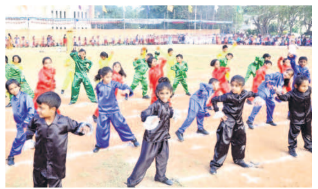
విన్నూరుల సాంస్కృతిక ప్రదర్శనలు

20వ తేదీ నుంచి దరఖాస్తుల స్వీకరణ జనవరి ఒకటో తేదీ వరకు 18 ఏళ్లు నిండిన యువతీ యువకులు అర్హుల సవరణలు, మార్పులు, చేర్పులకు అవకాశం కల్పించిన ఎన్నికల సంఘం