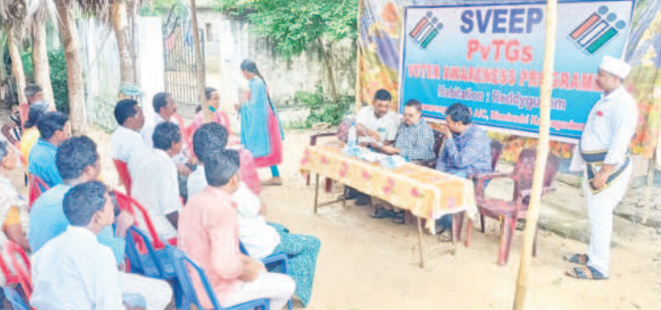
అసెంబ్లీ ఎన్నికల సమయంలో ఓటు హక్కుపై అవగాహన కల్పిస్తున్న అధికారులు(ఫైల్)