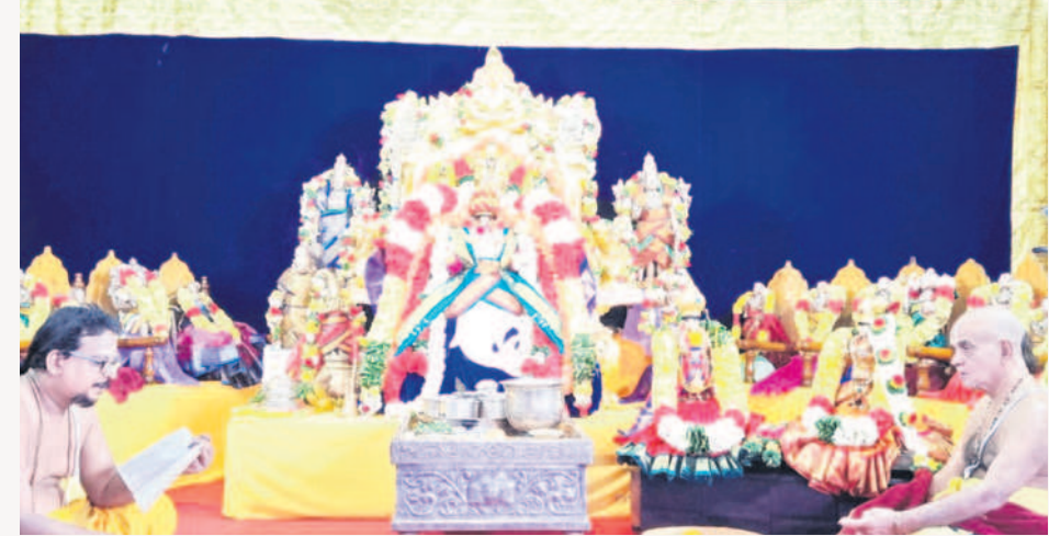
కూర్మావతారంలో భక్తులకు దర్శనమిస్తున్న కోదండ రామడు

భద్రాచలం, డిసెంబర్ 14 : భద్రాచలం సీతారామచంద్రస్వామి దివ్యక్షేత్రంలో దేవస్థానం అధ్యక్షంలో నిర్వహిస్తున్న ముక్కోటి ఏకాదశి అర్చనయనోత్సవాల వైభవంగా కొనసాగుతున్నాయి. గురువారం రెండో రోజు భద్రాద్రి రామయ్య కూర్మావతారంలో భక్తులకు దర్శనమివ్వగా.. స్వామివారిని చూసి మురిసిపోయారు. ఉదయం స్వామివారి సత్కల్యాణ మూర్తులను, ఉత్సవ మూర్తులను బేదా మండపానికి తీసుకొచ్చి ప్రత్యేక అభిషేకం నిర్వహించారు. ప్రత్యేక పూజలు చేసిన తర్వాత స్వామివారికి వేద విన్నపాలు చేశారు. అనంతరం స్వామివారిని అంతరాలయంలోకి తీసుకొనికూర్మావతారంలో అలంకరించి బేదా మండపానికి తీసుకొచ్చి అర్చనలు చేశారు. నాలాయిర దివ్య ప్రబంధంలోని 200 పాఠాలు, వేద పారాయణం పఠించారు. తర్వాత స్వామివారికి రాజభోగం సమర్పించారు. బేదా మండపంలో స్వామివారిని భక్తుల దర్శనార్థం ఉంచి మూర్త్యులను 2 గంటలకు సమస్త మంగళవాద్యాలను, వేద పండితుల వేద ఘోషలతో, కోలాట నృత్యాలతో గోదావరి తీరానికి తీసుకొచ్చారు. అక్కడి నుంచి మిథిలా స్టేడియానికి తీసుకొచ్చి హారతలు సమర్పించి.. అర్చనలు చేశారు. జిల్లాలోని వివిధ ప్రాంతాల నుంచి భక్తులు ఆదిక సంఖ్యలో తరలివచ్చి కూర్మావతారంలో ఉన్న స్వామివారిని