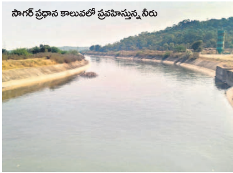
సాగర్ ప్రధాన కాలువలో ప్రవహిస్తున్న నీరు