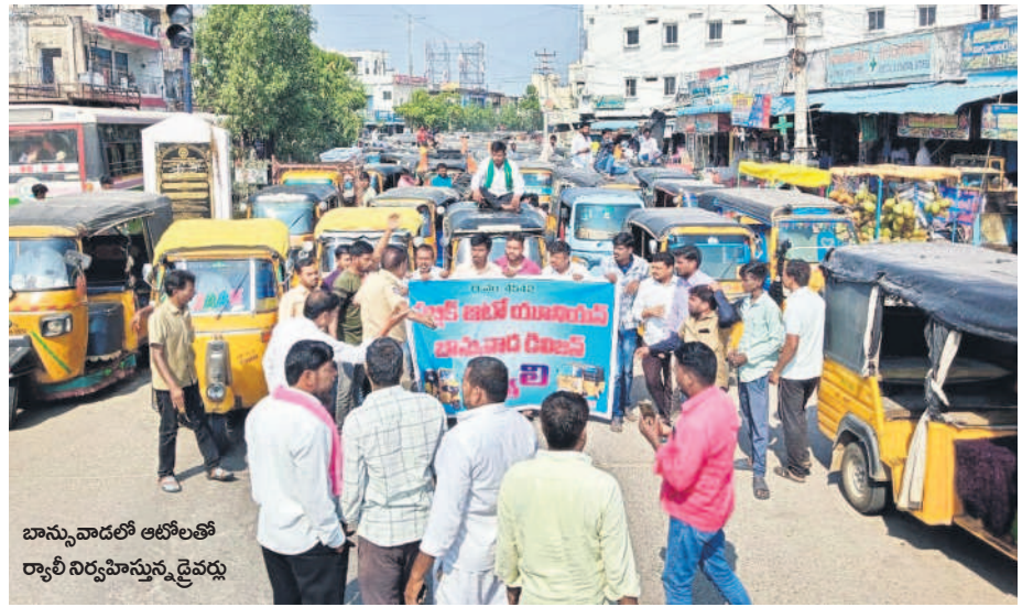
బాన్సువాడలో ఆటోలతో ర్యాలీ నిర్వహిస్తున్న డ్రైవర్లు