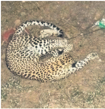
రోడ్డు ప్రమాదంలో మృతి చెందిన చిరుత