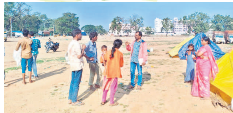
చిన్నారులతో పని చేయిస్తున్న యజమానులతో మాట్లాడుతున్న విద్యాశాఖ అధికారులు