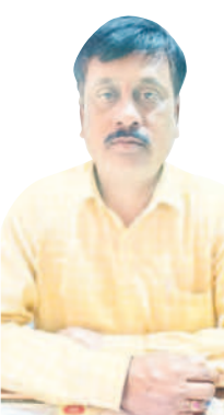
-రాజు, డీకెఎస్, కామారెడ్డి

విద్యా హక్కు చట్టం ప్రకారం 14 ఏండ్ల పిల్లల పాఠశాలలోనే ఉండాలి. వారిని ఎలాంటి పనుల్లో ఉంచకూడదు. అలా చేసిన యజమానులు, తల్లిదండ్రులపై చట్టరీత్యా చర్యలు తీసుకుంటారు. బడిబయట పిల్లలను గుర్తించి తల్లిదండ్రులు, యజమానులకు కొన్నెలింగ్ జన్మనాం. ఈ సర్వే వచ్చే నెల 11 వరకు కొనసాగుతుంది.