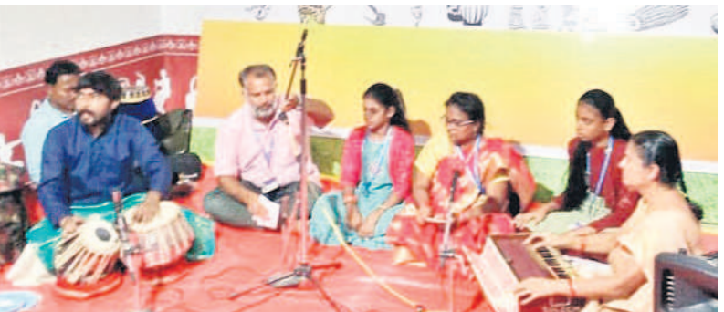
సంగీత సాధన చేస్తున్న కళాకారులు

నిజామాబాద్ కల్చరల్, డిసెంబర్ 14: శిశుర్యక్తి, పురుష్యక్తి, వేత్తి గానరసం పటి. చిన్నపిల్లలు, పశువులు, పాములు ఇలా జీవజాలాన్నంత టిని రంజించేయగలిగి ద్వని సంగీతం. గీతం వాద్యం తదా నృత్యం. త్రయం సంగీత ముచ్చత్తే..