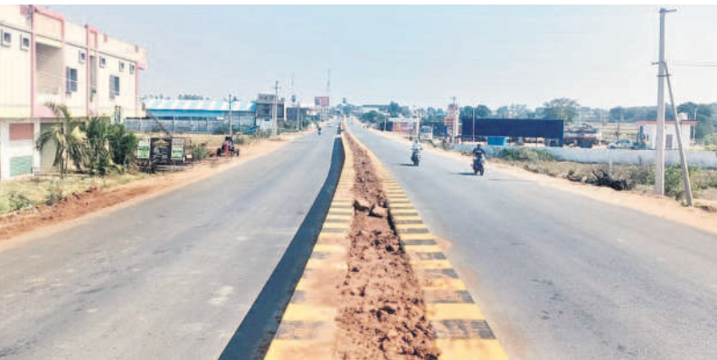
ఘనీపూర్ నుంచి గజ్యానాయక్ తండా మీదుగా మాచారెడ్డి వరకు ఏర్పాటు చేసిన ఫోన్లైన్ రోడ్డు