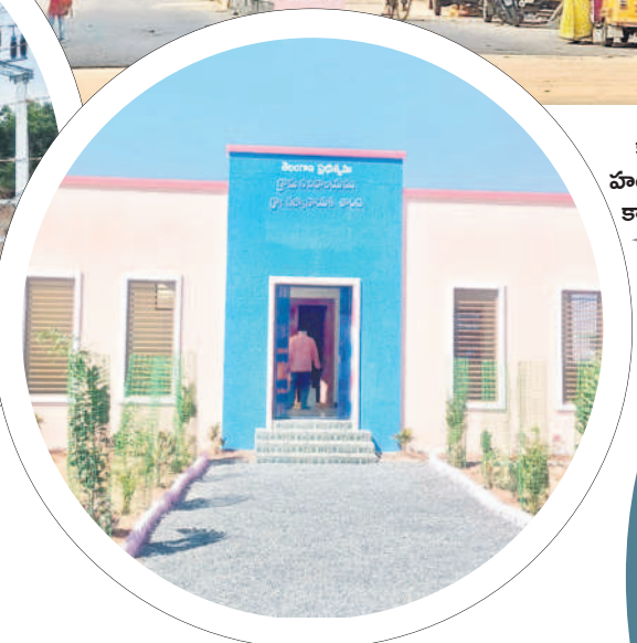
కార్పొరేట్ హాంగులతో జీపీ కార్యాలయం