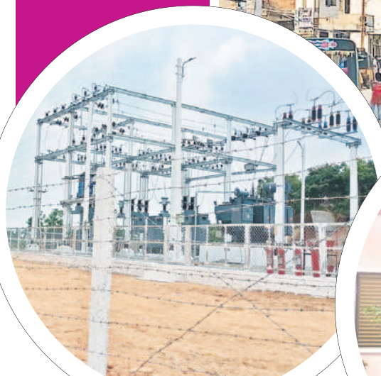
గ్రామంలో ఏర్పాటు చేసిన సబ్ స్టేషన్