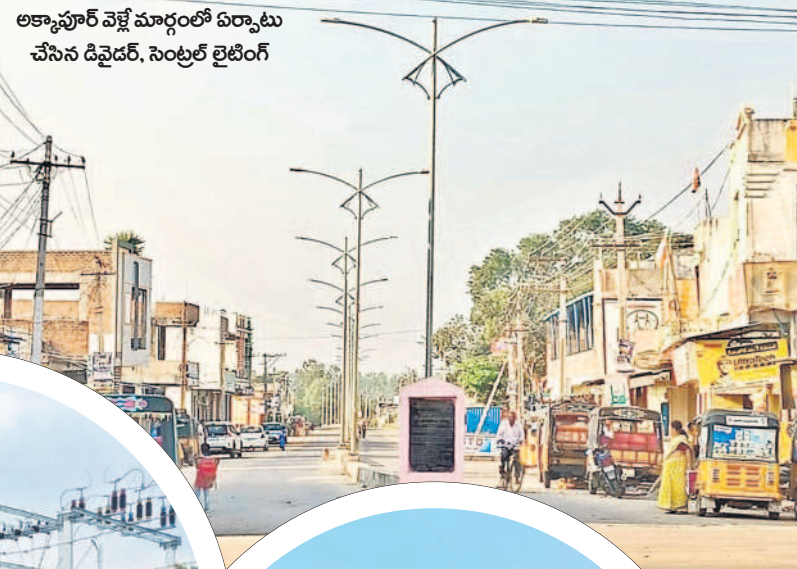
అక్కాపూర్ వెళ్లే మార్గంలో ఏర్పాటు చేసిన డివైడర్, సెంట్రల్ లైటింగ్