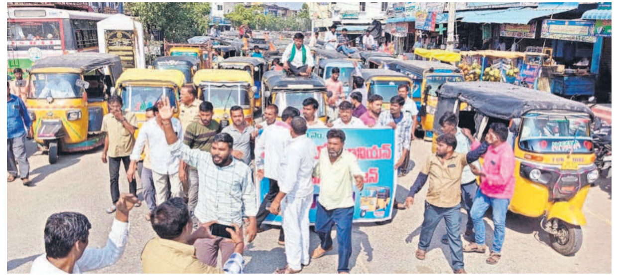
కాంగ్రెస్ ప్రభుత్వం ప్రవేశపెట్టిన ఉచితబస్సు ప్రయాణ పథకంతో తమ ఉపాధి దెబ్బతింటున్నదంటూ ఆటో కార్మికులు ఆందోళనలు చేపట్టారు. రోజురోజుకూ నిరసనల తీవ్రత పెరుగుతున్నది. ప్రీ బస్సుతో తమ బతుకులు అగమ్యుత్సన్నాయని వారం ఆందోళన వ్యక్తం చేస్తున్నారు. ఆటో డ్రైవర్లకు జీవన భృతి చెల్లించాలని ప్రభుత్వాన్ని డిమాండ్ చేస్తున్నారు. గురువారం కామారెడ్డి జిల్లా బాన్సువాడలో ఆటోలతో చేపట్టిన నిరసన రా్యాలీలో నిరదిన్న కార్మికులు.