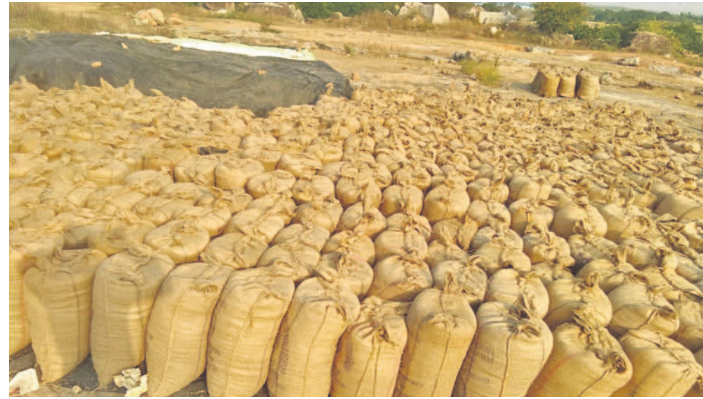
తూకం చేసిన సన్నరకం ధాన్యం