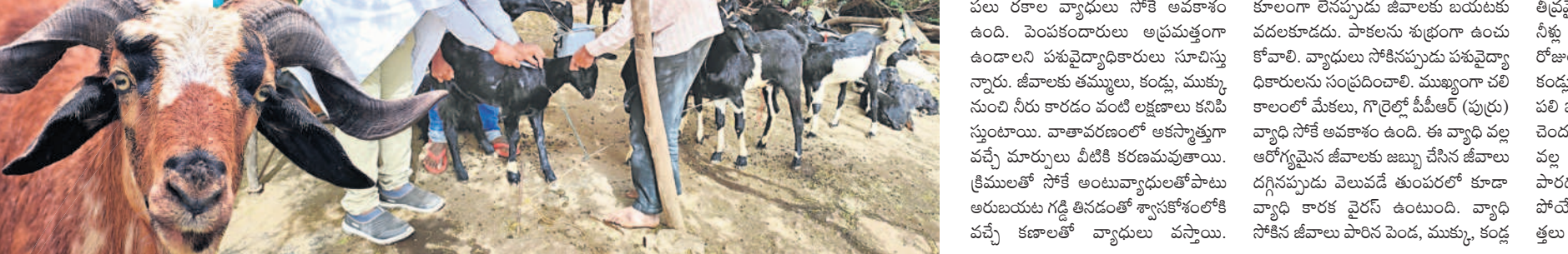
జీవాలకు ముందు జాగ్రత్త చర్యగా టీకాలు వేస్తున్న పశువైద్యాధికారులు

రూలు చెప్పుతున్నారు. ప్రస్తుతం వివిధ రకాలైన కావేరి చింటు, జైశ్రీరాం, బీటీటీ తదితర వాటికి క్వింటాలీకు రూ.5 వేల నుంచి రూ. 5,500 ధర పలుకుతున్నది. మంచి క్యాంటీ బియ్యం అయితే క్వింటాలీకు రూ.6 వేలు పలుకుతున్నాయి. వ్యాపారులు తమ తమ దుకాణాల్లో పంప రంగుల సంచుల్లో నింపి వివిధ రకాల పేర్లు పెట్టి అమ్ముతున్నారు. ఈ బియ్యంపై జాగ్రత్త అవసరం. వీటిలో చాలా వరకు స్టీమ్ రైస్ నింపి అధిక ధరలకు అమ్ముతున్నారు. రక రకాల పేర్లు పెట్టి అమ్ముడంతో వినియోగదారుల మోసపోయే ప్రమాదం ఉంది. బియ్యం కొనే వారు నేరుగా రైతు వద్ద కొనుగోలు చేస్తే నాణ్యమైన బియ్యం దొరుకుతాయి.