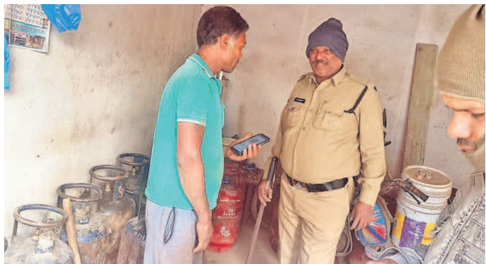
బొల్లారం పాలీట్రామికవాడలో గ్యాస్ రిఫిల్లింగ్ చేస్తున్న కేంద్రాల్లో తనిఖీ చేస్తున్న పోలీసులు

బొల్లారం, డిసెంబర్ 14 : ఐడీపీ బొల్లారం పాలీట్రామికవాడలోని గ్యాస్ అక్రమ రిఫిల్లింగ్ కేంద్రాల్లో పోలీసులు దాడులు చేశారు. ఎస్సీ రూపేజీ ఆదేశాల మేరకు పాలీట్రామికవాడలో జరుగుతున్న గ్యాస్ అక్రమ రిఫిల్లింగ్ దండాన్ని నిఘా పెట్టారు. రెండు రోజుల క్రితం జిల్లా స్పెషల్ ట్యాస్క్ ఫోర్స్ అధికారులు పలు కేంద్రాల్లో జరిపిన దాడుల్లో పెద్ద ఎత్తున 72 టేప్ మెన్సిక్ సిలిండర్లను స్వాధీనం చేసుకోవడమే కాకుండా అక్రమ రిఫిల్లింగుకు పాల్పడిన వ్యక్తులపై కేసులు నమోదు చేశారు. కాగా గురువారం స్థానిక సీబి నయోమొడ్డీని ఆధ్వర్యంలో కొత్తబస్తాండ్ సమీపంలోని పలు కాలనీల్లో గ్యాస్ అక్రమ రిఫిల్లింగ్ కేంద్రాలపై నిబ్బందితో తనిఖీలు నిర్వహించి పలు నంబర్లలో సిలిండర్లను స్వాధీనం చేసుకున్నారు. నిబంధనలకు విరుద్ధంగా గృహ సముదాయాల్లో అక్రమ రిఫిల్లింగుకు పాల్పడితే కేసులు నమోదు చేస్తామని నిరాహుతులను హెచ్చరించారు. స్వాధీనం చేసుకున్న సిలిండర్లపై సివిల్ సైబ్ అధికారులకు సమాచారం అందించి పోలీస్ స్టేషన్లకు తరలించారు. తనిఖీల్లో పోలీస్ నిబ్బంది పాల్గొన్నారు.