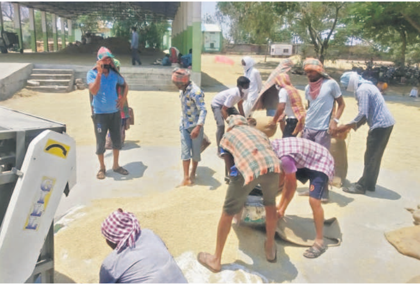
సన్నరకం ధాన్యాన్ని తూకం చేస్తున్న చూచూలీలు