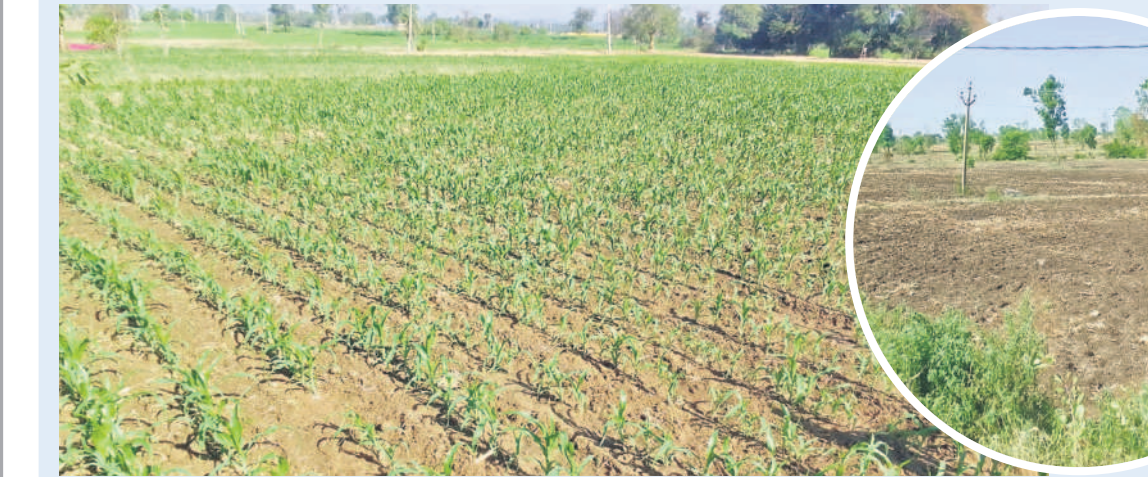
జీరో టిల్లేజ్ పద్ధతిలో సాగు చేసిన మొక్కజొన్న (ఇన్సెట్లో: జీరో టిల్లేజ్ ద్వారా మక్కసాగుకు సిద్ధం చేసిన భూమి)