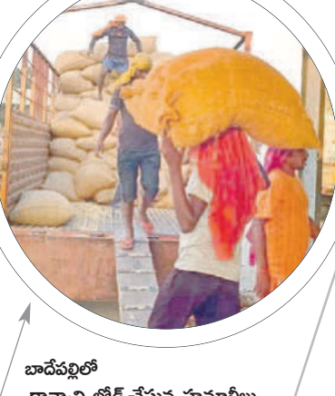
బాదేపల్లిలో ధాన్యాన్ని లోడ్ చేస్తున్న హమాలీలు

మంచి ధరలు వస్తున్నాయి. బీఆర్ఎస్ ప్రభుత్వ హయాంలో సన్నాలను సాగుచేయాలని రైతులకు సూచించడం జరిగింది. దాంతోఅప్పటి నుంచి రైతులు అధికంగా సస్పెంక్షనలను సాగుచేస్తున్నారు. అయితే యూసగిలో ఎక్కువగా ఉండటంతో వచ్చే సీజన్‌ను కూడా దృష్టిలో ఉంచుకొని వ్యాపారులు సస్పెంక్షనలకు ధరలు అధికంగా వేసి కొనుగోలు చేస్తున్నారు. ఈ ఏడాది వానకాలంలో లక్షా 90వేల ఎకరాల్లో పరిసాగు చేశారు. గతేడాది వానకాలంలో లక్షా 80వేల ఎకరాల్లో సాగుచేశారు. ఎకరాకు దాదాపుగా 40 నుంచి 45బస్తాల దిగుబడి వస్తున్నది. జిల్లాలో దాదాపు 9లక్షల 90వేల