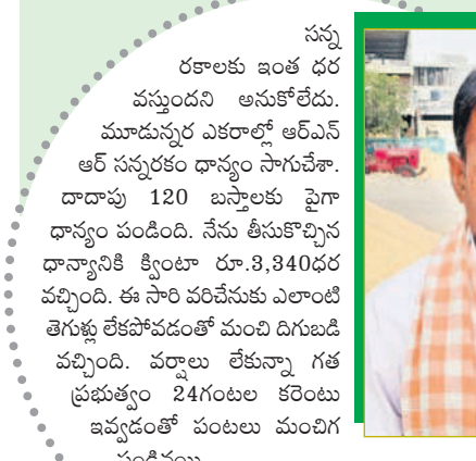
-వెంకటయ్య, కొండేడు, జడ్పీ మండలం