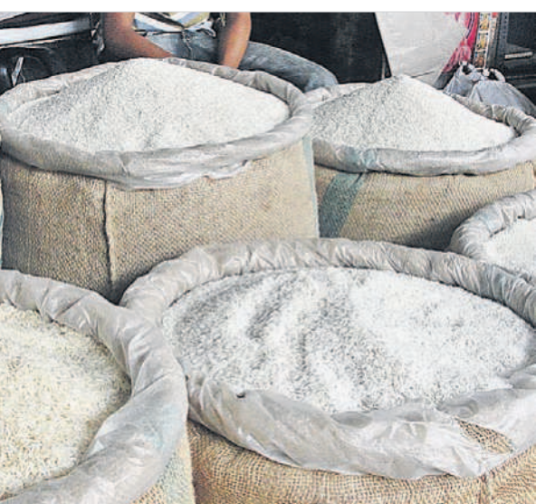
సన్నవడ్డ ధర పెరగడంతో..

సన్న వడ్డ ధర పెరగడంతో కొందరు రైతులు తాము పండించిన సన్న వడ్డను నేరుగా మిల్లకు తరలించి బియ్యంగా మార్చుకుంటున్నారు. బియ్యం ధర పెరుగుతున్నాయి. బియ్యం ఎక్కువగా ఉపయోగించే దేశాల్లో కరువు తదితర పరిస్థితుల వల్ల ఎక్కువ డిమాండ్ ఏర్పడింది. కేంద్ర ప్రభుత్వం బియ్యం ఎగుమతులకు 20శాతం పన్ను విధిస్తున్నా ఎగుమతులు ఆడగం లేదు. దీనికి తోడు మిగిలిన