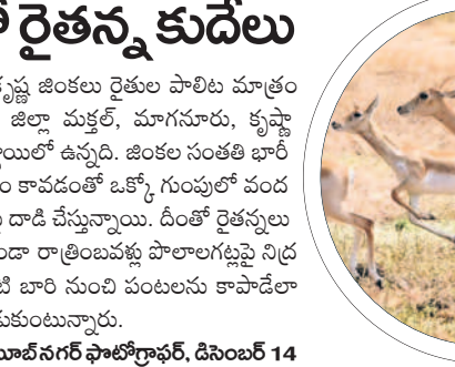
మక్కల్ మండలంలో సంచరిస్తున్న కృష్ణజింకలు

పర్యాటకులను కనుమిందు చేసే కృష్ణ జింకలు రైతుల పాలిట మాత్రం శాపంగా మారాయి. నారాయణపేట జిల్లా మక్కల్, మాగనూరు, కృష్ణా మండలాలలో కృష్ణ జింకల బెడద తీవ్ర స్థాయిలో ఉన్నది. జింకల సంతతి భారీ స్థాయిలో పెరిగిపోవడం, సడీ తీర ప్రాంతం కావడంతో ఒక్కో గుంపులో చంద నుంచి 150 జింకల వచ్చి పంట పొలాలపై దాడి చేస్తున్నాయి. దీంతో రైతన్నలు బెంబేలెత్తుతున్నారు. కంటిమీద కునుకులేకుండా రాత్రింబవళ్లు పొలాల గట్టుపై నిద్ర కాస్తా పంటలను కాపాడుకుంటున్నారు. వాటి బారి నుంచి పంటలను కాపాడేలా ప్రభుత్వం చర్యలు తీసుకోవాలని రైతన్నలు వేడుకుంటున్నారు.