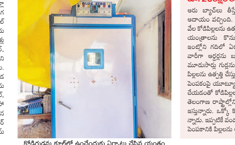
కోడిగుడ్డును కార్లో ఉంచేందుకు ఏర్పాటు చేసిన యంత్రం