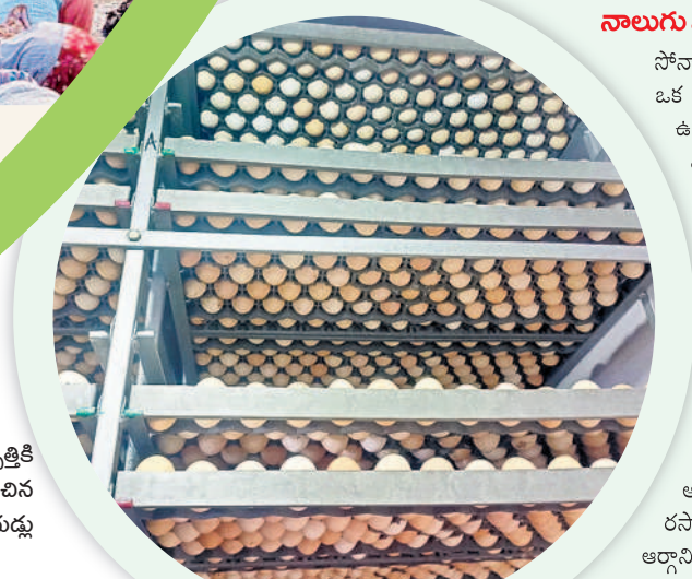
పిల్లల ఉత్పత్తికి యంత్రంలో ఉంది