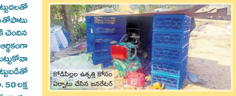
కోడిపిల్లల ఉత్పత్తి కోసం ఏర్పాటు చేసిన జనరేటర్