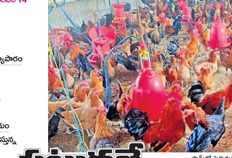
ఫామ్లో పెరుగుతున్న నాటుకోళ్ళు