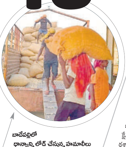
బాదేపల్లిలో ధాన్యాన్ని లోడ్ చేస్తున్న హమాలీలు

మంచి ధరలు వస్తున్నాయి. బీఆర్ఎస్ ప్రభుత్వ హయాంలో సన్నాలను సాగుచేయాలని రైతులకు సూచించడం జరిగింది. దాంతోఅప్పటి నుంచి రైతులు అధికంగా సన్నరకాలను సాగుచేస్తున్నారు. అయితే యాసంగిలో ఎక్కువశాతం 1010 డొడ్డరకం ధాన్యం సాగుచేసే అవకాశం ఎక్కువగా ఉండటంతో వచ్చే సీజన్ ను కూడా డ్యూటీలో ఉంచుకొని వ్యాపారులు సన్నరకాలకు ధరలు అధికంగా వేసి కొనుగోలు చేస్తున్నారు. ఈ ఏడాది వానాకాలంలో లక్షా 90వేల ఎకరాల్లో పరిసాగు చేశారు. గతేడాది వానాకాలంలో లక్షా 80వేల ఎకరాల్లో సాగుచేశారు. ఎకరాకు దాదాపుగా 40 నుంచి 45బస్తాల దిగుబడి వస్తున్నది. జిల్లాలో దాదాపు 9లక్షల 90వేల