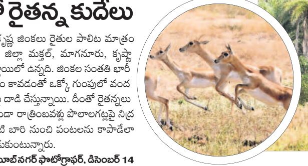
మక్కల్ మండలంలో సంచరిస్తున్న కృష్ణజంతులు

వెంట మంటలు పెడుతుండడంతో జంతువులు నీటి దాహాన్ని తీర్చుకునేందుకు వగటిపూట నది ప్రవాహం వడ్డను వస్తున్నాయి. దాహార్థి కోసం వచ్చే పులులు ఎక్కడ తమపై దాడి చేస్తాయనే భయంతో జూలూ, చెంపలు, సమీప గ్రామాల పశువుల కాపరులు, రైతులు భయందోహకంలో ఉన్నారు.