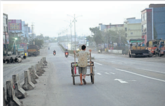
ఉదయం 6.01 గంటలు... తెల్లవారుజామున హైవే రోడ్డు