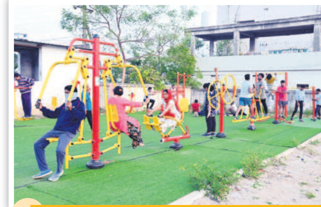
ఉదయం 6.15 గంటలు... కాలేజీ రోడ్డులో వి పిపి జిమ్