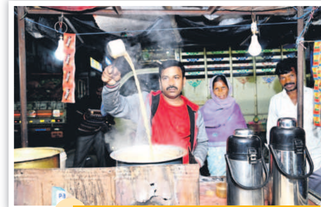
ఉదయం 4.20 గంటలు... మార్కెట్లో టీ చేస్తూ..