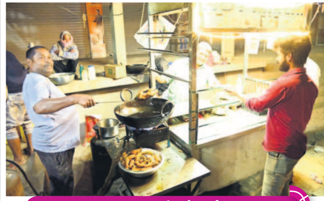
రాత్రి 10.30 గంటలు... మార్కెట్ రోడ్డులో మిర్చి వేస్తున్న దుకాణదారు