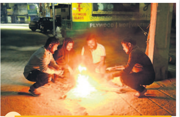
అర్ధరాత్రి 1.03 గంటలు... చలి కాగుతున్న యువకులు