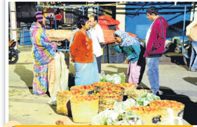
ఉదయం 4.06 గంటలు... కురగాయలు కొనుగోలు చేస్తున్న వ్యాపారులు