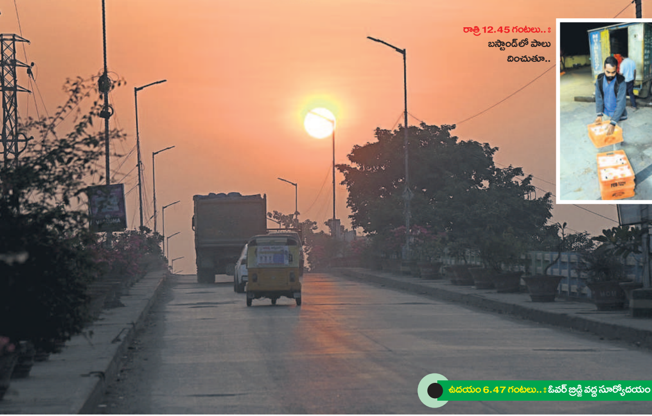
రాత్రి 12.45 గంటలు... బస్టాండ్లో పాలు దించుతూ...