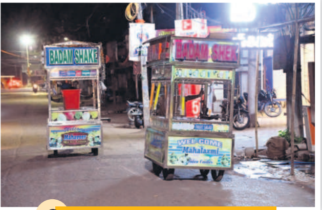
రాత్రి 10.40 గంటలు... మార్కెట్ రోడ్డులో జ్యూస్ బండ్లు