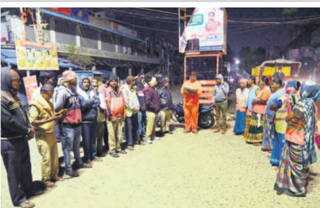
ఉదయం 4.50 గంటలు... మున్సిపల్ కార్మికుల హాజరు తీసుకుంటున్న జవాన్