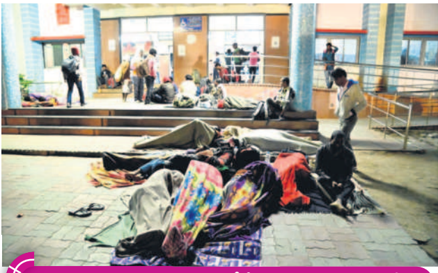
రాత్రి 10.15 గంటలు... మంచిర్యాల రైల్వే స్టేషన్ ఎదుట నిర్బంధ ప్రయాణికులు