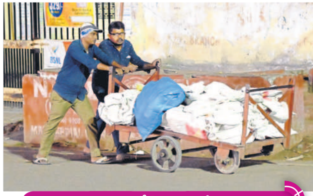
రాత్రి 10.21 గంటలు... పోస్టాఫీసుకు పార్కర్లను తీసుకెళ్తున్న సిబ్బంది