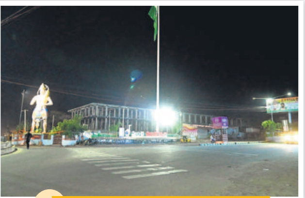
రాత్రి 11.15 గంటలు... నిర్మాణవ్యంగా ఉన్న ఐటీ చౌరస్తా