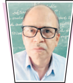
ప్రత్యక్ష బోధనతో ఆసక్తి పెరుగుతుంది