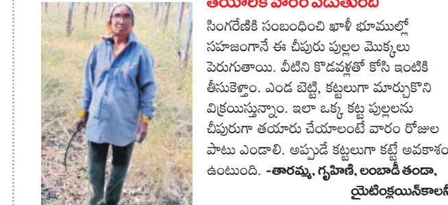
అందజేసి ఆర్థికంగా కొంత మేర నిలదొక్కుకుంటున్నాం.

తయారీకి వారం పడుతుంది సింగరేణికి సంబంధించి ఖాళీ భూముల్లో సహజంగానే ఈ చీపురు పుల్లల మొక్కలు పెరుగుతాయి. వీటిని కోడవల్లతో కోసి ఇంటికి తీసుకెళ్తారు. ఎండ బెట్టి, కట్టలుగా మార్చుకొని విక్రయిస్తున్నారు. ఇలా ఒక్క కట్టి పుల్లలను చీపురుగా తయారు చేయటంలే వారం రోజుల పాటు ఎండాలి. అప్పుడే కట్టలుగా కట్టే అవకాశం ఉంటుంది. -ఆరవల్లి, గృహిణి, లంబాడీ తండా, యెలెంక్షయినకాలని