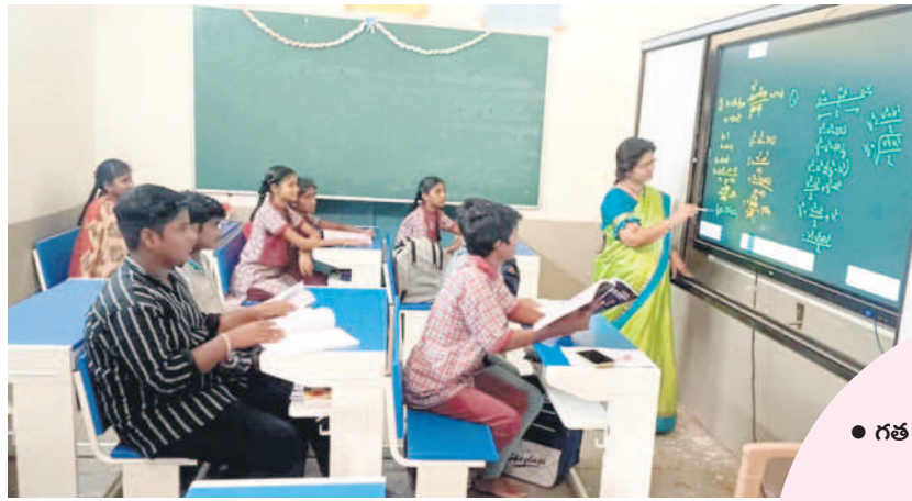
జడ్పీ ఉన్నత పాఠశాల(బాలుర)లో డిజిటల్ పాఠాలను బోధిస్తున్న ఉపాధ్యాయురాలు