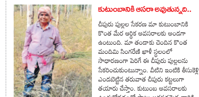
అందజేసి ఆర్థికంగా కొంత మేర నిలదొక్కుకుంటున్నాం.