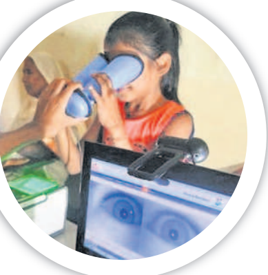
మీసిన నెంబర్లో అప్డేట్ చేసుకుంటున్న ప్రజలు

ఉచితంగా ఆన్లైన్ చేసుకునే విధానాన్ని ఒకసారి పరిశీలిస్తే.. ఉదాయ్ పోర్టల్లో https://myaadhaar.uidai.gov.in ఆధార్ నంబర్ ద్వారా లాగిన్ కావాలి. ప్రొసీడ్ టూ అప్డేట్ ఆప్షన్ పై క్లిక్ చేయాలి. ఆధార్ రిజిస్టర్డ్ మొబైల్ నంబర్ కు ఓటీపీ వస్తుంది. ఓటీపీ ఎంటర్ చేసిన ఆనంతరం డాక్యుమెంట్ అప్డేట్ ఆప్షన్ పై క్లిక్ చేయాలి. వివరాలు స్క్రీన్ పై వస్తాయి. వాటిని పూర్తిగా పరిశీలించి, సవరణ ఉంటే చేయాలి. లేదంటే ఉన్న వివరాలతోనే నెక్స్ట్ పై క్లిక్ చేయాలి. కిందకు స్క్రోలింగ్ చేస్తే ఫ్రామ్ ఆఫ్ ఐడెంటిటీ, ఫ్రూఫ్ ఆఫ్ ఆడ్రస్ డాక్యుమెంట్లను ఎంచుకోవాలి. ఆయా డాక్యుమెంట్లను స్కాన్ చేసి అప్లోడ్ చేయాలి. సబ్మిట్ బటన్ పై క్లిక్ చేయాలి. పద్నాలుగు అంకెల అప్డేట్ రిక్వైస్ట్ నెంబర్ వస్తుంది. దీని ద్వారా స్టేషన్ తెలుసుకోవచ్చు.