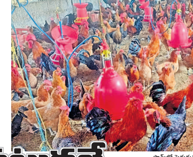
ఫామ్లో పెరుగుతున్న నాటుకోళ్ళు