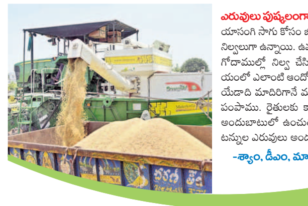
యానంగి సాగు కోసం జిల్లాలో ఎరువులు పుష్కలంగా బఫర్ నిల్వలగా ఉన్నాయి. ఉమ్మడి జిల్లా మొత్తానికి సరిపోయే స్థానం గోదాముల్లో నిల్వ చేసి ఉంచారు. రైతులు ఎరువుల విషయంలో ఎలాంటి ఆందోళన చెందాల్సిన అవసరం లేదు. ప్రతి యేడాది మాదిరిగానే ముందస్తుగానే ఎరువుల ఇంజనీరింగును పంపాము. రైతులకు కావాల్సిన అన్ని రకాల ఎరువులను అందుబాటులో ఉంచుతున్నాం. ప్రస్తుతం 77.41 మెట్రిక్ టన్నుల ఎరువులు అందుబాటులో ఉన్నాయి.

ఎరువులకు కరువు లేదు యానంగి పంట సాగుకు సంబంధించి ఎరువుల విషయంలో ఎలాంటి జోకా లేకుండా గత ప్రభుత్వమే చర్యలు తీసుకున్నది. అవసరాలకు మించి ఎరువులు తెలంగాణ రాష్ట్ర మార్కెట్లో వడ్డ నిల్వలు ఉన్నాయి. ముందస్తు ప్రణాళికతో అన్ని రకాల ఎరువులను గోదాముల్లో నిల్వ ఉంచారు. ప్రస్తుతం ఉన్న నిల్వలు యానంగి సాగు కోసం ఉమ్మడి వరంగల్ జిల్లా మొత్తానికి సరిపోయే స్థాయిలో నిల్వ ఉంచారు. యూరియా 7006 మెట్రిక్ టన్నులు, డీపీ 424 మెట్రిక్ టన్నులు, ఇతర కాంప్లెక్స్ ఎరువులు 310 మెట్రిక్ టన్నులు నిల్వ ఉన్నాయి. పంట దిగుబడిలో అత్యంత ప్రాముఖ్యత ఉండి పోటాషను సైకం అందుబాటులో ఉంచారు. జిల్లాలో మొత్తంగా చూస్తే 7741.405 మెట్రిక్ టన్నుల ఎరువులు బఫర్ నిల్వలగా అందుబాటులో ఉన్నాయి.