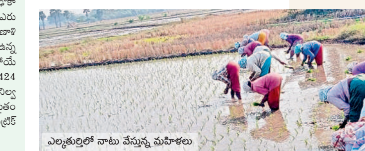
ఎల్కాశుద్రిలో నాటు వేస్తున్న మహిళలు

హనుమకొండ నబర్నన్, డిసెంబర్ 14 : జిల్లాలో యానంగి సాగు పనులు ఇప్పుడే జోరందుకుంటున్నాయి. పివైపు ఇంకా పరిశోధన కొనసాగుతున్నా మరోవైపు పరినాట్లు మొదలయ్యాయి. ఈ సారి కూడా పరిని ప్రధాన పంటగా వ్యవసాయ ఆధికారులు అంచనా వేశారు. రెండో ప్రధాన పంటగా మొక్కజొన్న వైపు రైతులు మొగ్గు చూపుతున్నారు. ఈసారి వర్షాలు తక్కువే వడినా ఒకేసారి కరిసిన భారీ వర్షాలతో అన్ని చెరువులూ పూర్తి స్థాయిలో నిండి కళకళలాడుతున్నాయి. దీనితో వ్యవసాయానికి ప్రధాన అయివుపట్టుగా ఉన్న ఎస్సార్సెన్సి, దేవాదుల ప్రాజెక్టుల వీళ్ళ అందుబాటులో ఉన్నాయి. భూగర్భ జలాలు కూడా పుష్కలంగా ఉండడంతో బావులు, బోర్ల ద్వారా వచ్చే నీటితో రైతులు యానంగి పంటకు సరిపడా సాగునీరు అందుతుంది. హనుమకొండ జిల్లాలోని ఎల్కాశుద్రి, కమలాపూర్, హనువపర్తి, దామెర, భీమదేవరపల్లి, వేలేడు, ధర్మసాగర్, ఐనవోలు, హనుమకొండ, నడికూడ మంలా లాల్లో పరి కోతలు పూర్తయి నాల్గ పోషకుని పొలాలూ దున్నే పనిలో ఉన్నారు. ముందస్తుగా నారు పోషకున్న రైతులు ఏకంగా నాట్లు వేస్తున్నారు. ఇతర వరకాల, కాయంపేట, అత్త కూర మండలాల్లో ఇంకా పరి కోతలు, దాన్యం తరలింపు పంటి పనులు కొనసాగుతున్నాయి. పత్తి వేస్తు పూర్తి చేసిన రైతులు మళ్ళీ పంటను కూడా వేస్తున్నారు. మరోవైపు ఇతర పప్పు దినుసుల పంటలను కూడా వేసుకుంటున్నారు.