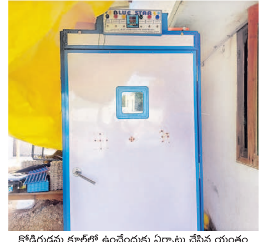
కోడిగుడ్డును కూల్లో ఉంచేందుకు ఏర్పాటు చేసిన యంత్రం

6 బ్యాచ్లకు రూ. 20 లక్షల ఆదాయం ఆరు బ్యాచ్లకు తీస్తే రూ. 20 లక్షల ఆదాయం వచ్చింది. దాంతో ఒకేసారి 18 వేల కోడిపిల్లలను ఉత్పత్తి చేసే కెపాసిటీ గల యంత్రాలను కొనుగోలు చేసి వాటిని ఇంట్లోని గదిలో ఏర్పాటు చేశాడు. దళ వారీగా ఆర్డర్లను బట్టి ఆరువేల చొప్పున మూడుసార్లు గుడ్డును యంత్రంలో పెట్టి కోడి పిల్లలను ఉత్పత్తి చేస్తున్నాడు. కోడిపిల్లల ఉత్పత్తి పెంపకంపై యూట్యూబ్ చానల్ ద్వారా ప్రచారం చేయడంతో కోడిపిల్లల కొనుగోలుకు ఆంధ్రప్రదేశ్, తెలంగాణ రాష్ట్రాల్లో అన్ని జిల్లాల నుంచి ఆర్డర్లు ఇస్తున్నారు. ఒక్కో కోడిపిల్ల రూ. 35 కు విక్రయంస్తు న్నాడు. ఇప్పటికే వందమందికి పైగా రైతులకు నాటుకోళ్ళ పెంపకానికి పిల్లలను అమ్మినట్లు చెప్పాడు.