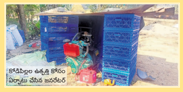
కోడిపిల్లల ఉత్పత్తి కోసం ఏర్పాటు చేసిన జనరలర్