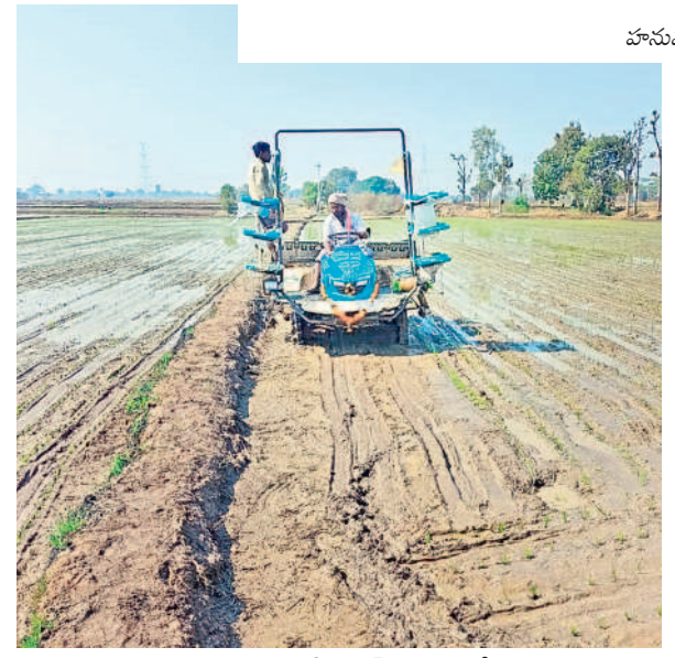
కమలాపూర్ మండలంలో మిషిన్తో నాటు వేస్తున్న రైతు

ఎరువులకు కరువు లేదు యానంగి పంట సాగుకు సంబంధించి ఎరువుల విషయంలో ఎలాంటి జోకా లేకుండా గత ప్రభుత్వమే చర్యలు తీసుకున్నది. అవసరాలకు మించి ఎరువులు తెలంగాణ రాష్ట్ర మార్కెట్లో వడ్డ నిల్వలు ఉన్నాయి. ముందస్తు ప్రణాళికతో అన్ని రకాల ఎరువులను గోదాముల్లో నిల్వ ఉంచారు. ప్రస్తుతం ఉన్న నిల్వలు యానంగి సాగు కోసం ఉమ్మడి వరంగల్ జిల్లా మొత్తానికి సరిపోయే స్థాయిలో నిల్వ ఉంచారు. యూరియా 7006 మెట్రిక్ టన్నులు, డీపీ 424 మెట్రిక్ టన్నులు, ఇతర కాంప్లెక్స్ ఎరువులు 310 మెట్రిక్ టన్నులు నిల్వ ఉన్నాయి. పంట దిగుబడిలో అత్యంత ప్రాముఖ్యత ఉండి పోటాషను సైకం అందుబాటులో ఉంచారు. జిల్లాలో మొత్తంగా చూస్తే 7741.405 మెట్రిక్ టన్నుల ఎరువులు బఫర్ నిల్వలగా అందుబాటులో ఉన్నాయి.