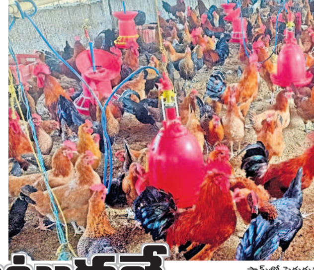
ఫామ్లో పెరుగుతున్న నాటుకోళ్ళు