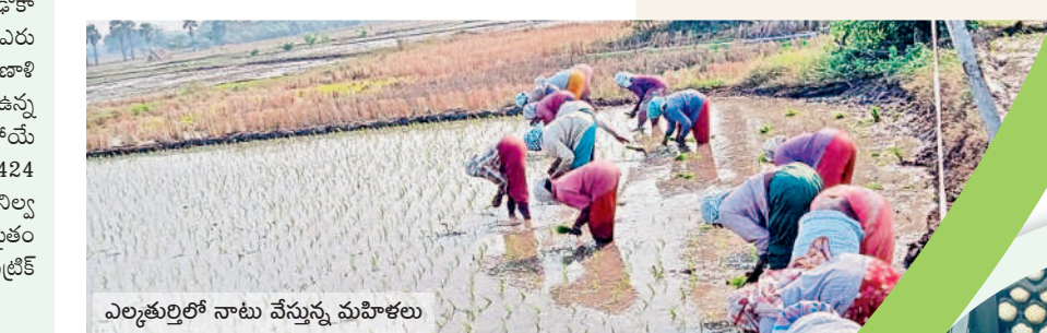
ఎల్లూతుర్తిలో నాటు వేస్తున్న మహిళలు

హనుమకొండ నబర్నన్, డిసెంబర్ 14 : జిల్లాలో యానంగి సాగు పనులు ఇప్పుడే జోరందుకుంటున్నాయి. పివైపు ఇంకా పరిశోధన కొనసాగుతున్నా మరోవైపు పరినాట్లు మొదలయ్యాయి. ఈ సారి కూడా పరిని ప్రధాన పంటగా వ్యవసాయ ఆధికారులు అంచనా వేశారు. రెండో ప్రధాన పంటగా మొక్కజొన్న వైపు రైతులు మొగ్గు చూపుతున్నారు. ఈసారి వర్షాలు తక్కువే వడినా ఒకేసారి కరిసిన భారీ వర్షాలతో అన్ని చెరువులూ పూర్తి స్థాయిలో నిండి కళకళలాడుతున్నాయి. దీనితో వ్యవసాయానికి ప్రధాన అయివుపట్టుగా ఉన్న ఎస్సార్సెన్సి, దేవాదుల ప్రాజెక్టుల వీళ్ళ అందుబాటులో ఉన్నాయి. భూగర్భ జలాలు కూడా పుష్కలంగా ఉండడంతో బావులు, బోర్ల ద్వారా వచ్చే నీటితో రైతులు యానంగి పంటకు సరిపడా సాగునీరు అందుతుంది. హనుమకొండ జిల్లాలోని ఎల్లూతుర్తి, కమలాపూర్, హనువపర్తి, దామెర, భీమదేవరపల్లి, వేలేడు, ధర్మసాగర్, ఐనవోలు, హనుమకొండ, నడికూడ మంలా లాల్లో పరిశోధన పూర్తయి నాల్గో పోషకుని పొలాలూ దున్నే పనిలో ఉన్నారు. ముందస్తుగా నారు పోషకున్న రైతులు ఏకంగా నాట్లు వేస్తున్నారు. ఇక వరకాల, కాయంపేట, అత్త కూర్ మండలాల్లో ఇంకా పరిశోధనలు, దాన్యం తరలింపు పంటి పనులు కొనసాగుతున్నాయి. పత్తి వేస్తు పూర్తి చేసిన రైతులు మళ్ళీ పంటను కూడా వేస్తున్నారు. మరోవైపు ఇతర పప్పు దినుసుల పంటలను కూడా వేసుకుంటున్నారు.