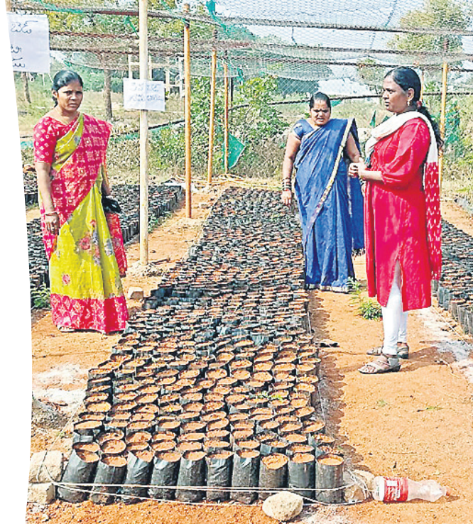
జీవనగర్ మండలం నెమరుగొమ్మలో కొనసాగుతున్న నర్సరీ పనులు