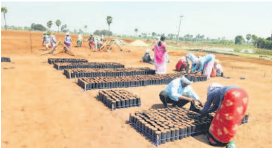
కొనసాగుతున్న నర్సరీ పనులు

యాదాద్రి నర్సరీల్లో అధికారులు రకరకాల మొక్కలు పెంచుతున్నారు. పండ్లు, పూలు, నీడనిచ్చే సుమారు 30 రకాల మొక్కలు అందుబాటులో ఉన్నాయి. జామ, అల్లనేరేడు, చక్రమల్లె, మందారం, నేరేడు, మల్లె, చామంతి, వాటర్ ఆపిల్, గన్నేరు, నూరు పరహాలు, మైదా, గులాబీ, గుర్రమోహరీ, పెద్ద ఫోరం, దానిమ్మ, కానుగ, పారిజాతం, టికోమా, శ్రీగంధం, నెమలినాగ, మేప, కరంబ, నిద్రగన్నేరు, బాదాం, బోహమియా, స్వతోడియా, చింత, సీతాఫలం, నరసా, సిల్వీయా తదితర మొక్కలు పెంచుతున్నారు. రకరకాల మొక్కలతో నర్సరీలు పచ్చదనం చూచుకొని చిట్టడమిని తలపిస్తున్నాయి.