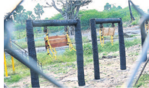
మినీ శిల్పారామంలో బిన్నార్ల ఆటస్థలం

భక్తులు రాయగిరి చెరువును వీక్షించేందుకు వైటిడి ప్రత్యేక ఏర్పాట్లు చేసింది. నాలుగు చోట్ల వాటర్ ఫౌంటెయిన్లను నిర్మించింది. చెరువులో నీళ్లు ఆకాశాన్ని తాకితా మహాద్భుతంగా తీర్చిదిద్దారు. చెరువులో బోటింగ్ చేసేందుకు ప్రత్యేకమైన బోటింగ్ ను సిద్ధం చేశారు. ఒక బోటులో ఇద్దరు కూర్చునేలా సౌకర్యవంతంగా తీర్చిదిద్దారు.