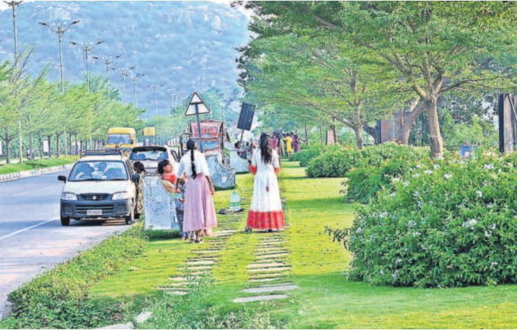
రాయగిరి చెరువుకట్ట ఫుట్ పాత్ పై సేద తీరుతున్న భక్తులు

ఫౌంటెయిన్లు, బోటింగ్ తో ఆహ్లాదకరంగా చెరువు