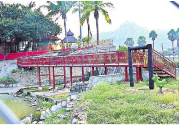
మినీ శిల్పారామంలో బిన్నార్ల ఆటస్థలం

మినీ శిల్పారామం.. రాయగిరి చెరువు అలుగు పోసే ప్రాంతంలో రెండేకరాలలో శిల్పారామంను అద్భుతంగా నిర్మించారు. 1.20 ఎకరాల్లో అభివృద్ధి పనులు చేపట్టగా పరిసరాలన్నీ పచ్చదనంతో వెల్లివిరిసేలా గ్రీనరి ఏర్పాటు చేశారు. శిల్పారామంలోకి ప్రవేశించే మార్గంలో సాగ్లంతో రణం నిర్మించారు. పిల్లలు ఆడుకునేందుకు, పెద్దలు సేద తీరేందుకు మైదానాన్ని సిద్ధం చేశారు. విభిన్న రుచులతో ఫుడ్ కోర్టు ఏర్పాటు చేశారు. చెరువు మధ్యలో ఇలాండ్, పక్కనే పంచెన పంటి నిర్మాణాలతోపాటు బోటింగ్ కు సన్నాహాలు చేస్తున్నారు. ఎటువూ సినా చక్కటి పల్లె వాతావరణం వెల్లివిరిసేలా నిర్మించారు. రాత్రివేళల్లో పరిసరాలన్నీ జిగితే అనిపించేలా రాయగిరి ప్రాంతాన్ని తీర్చిదిద్దారు. శిల్పకళా, హస్తకళా వైభవం ఉట్టి పడే విధంగా రాయగిరి చెరువు ప్రాంతాన్ని అద్భుతంగా తీర్చిదిద్దారు.