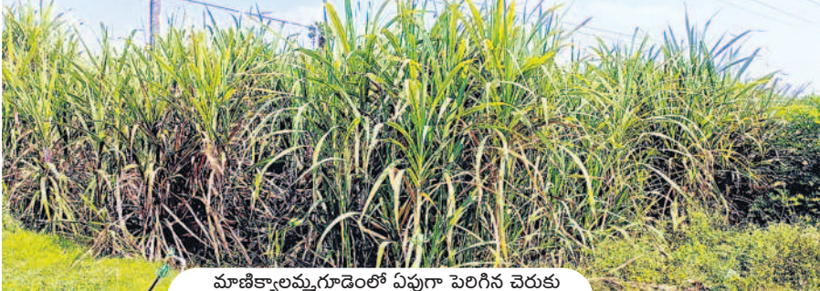
మాణిక్యాలమ్మగూడెంలో ఏపూగా పెరిగిన చెరుకు