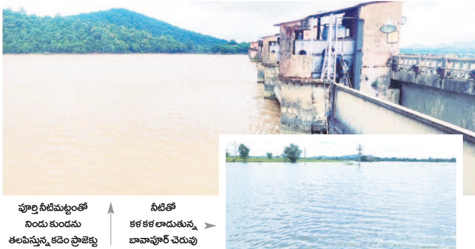
పూర్తి నీటిమట్టంతో నిండు కుండను తలపిస్తున్న కడెం ప్రాజెక్టు