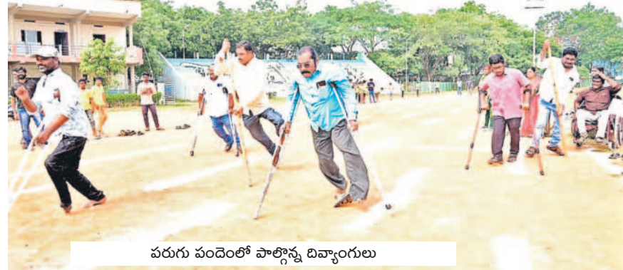
వరుగు చందెంలో పాల్గొన్న దివ్యాంగులు