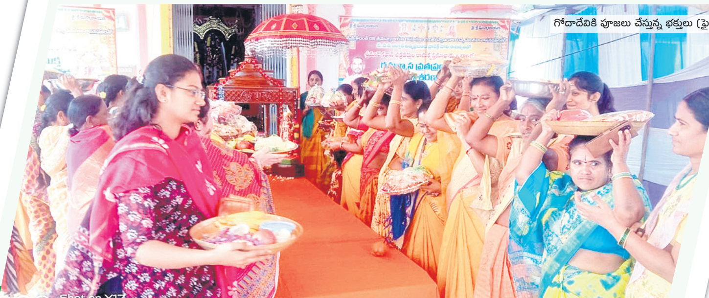
గోదాదేవికి పూజలు చేస్తున్న భక్తులు (ఫైల్)

భక్తవత్సలుడు శ్రీమహావిష్ణువుకు అత్యంత ప్రీతిపాత్రమైన ఈ ధనుస్యం. ఈ మాసంలో ఆ స్వామిని ఉద్దేశించి చేసే చిన్నపాటి పూజా దీక్షకువైన ఇక్షుడు అమోఘ సకలికాలను ప్రసాదిస్తున్న దివ్యోక్తి. ఈ మాస దివ్య ప్రభావం వల్ల గోదాదేవి సాక్షాత్కార ఆ రంగనాయకుని పరిణయమాడిందని పురాణాలు చెబుతున్నాయి. సాక్షాత్కార భూదేవి అవతారమూర్తయిన ఆంధ్రాక్షు రవిచంద్రుని దివ్యప్రబంధమే తిరుప్పావై. తిరు అంటే మంగళకర్షణ అని, పావై అంటే మేలుకొలుపు అని అర్థం. ఈ మాసంలో విష్ణువును మధుసూదనుడు అనే పేరుతో పూజించి మొదటి 15 రోజులు చక్కెర పొంగలి లేదా పులగం స్వామికి నైవేద్యంగా సమర్పించాలి. తర్వాత 15 రోజులు దధీజనం అర్పించాలి. పెళ్ళిడు యువకులు తమ ఇళ్ల ముంగిట ముగ్గులు, గొబ్బెమ్మలతో పూజలు చేయడం వల్ల కోరిన వరుడు లభిస్తాడని నమ్మతారు. ఈ నెలలో ప్రతిరోజూ సూర్యోదయానికి ఐదు గడియారులు