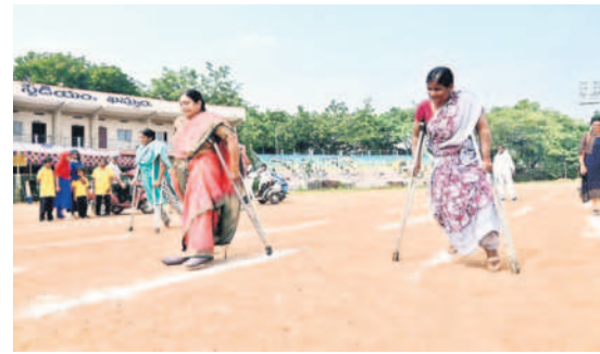
రన్నింగ్లో పాల్గొన్న దివ్యాంగులు

ర్భంగా ఆమె మాట్లాడుతూ ఆటల్లో ప్రతి భగవంతుని పలువురు దివ్యాంగులను రాష్ట్రస్థాయి దివ్యాంగుల క్రీడలకు ఎంపిక చేయనున్నట్లు తెలిపారు. ప్రతి సంవత్సరం మాదిరిగానే ఈ ఏడాది కూడా దివ్యాంగులకు క్రీడలు నిర్వహించామన్నారు. కొద్ది రోజుల్లోనే జిల్లా మంతులు, కలెక్టర్ అనుమతితో దివ్యాంగుల దినోత్సవ వేడుకలు నిర్వహించేందుకు తేదీ ప్రకటించామన్నారు. ఆది రోజు క్రీడల్లో గెలుపొందిన దివ్యాంగులకు బహుమతులు ప్రధానం చేయనున్నట్లు పేర్కొన్నారు. వివిధ గ్రామాల నుంచి వందల సంఖ్యలో తరలివచ్చి క్రీడలను విజయవంతం చేసిన ప్రతి ఒక్కరికి ఆమె కృతజ్ఞతలు తెలిపారు. కార్యక్రమంలో పలువురు సంక్షేమ శాఖ అధికారులు, స్వచ్ఛంద సంస్థల ప్రతినిధులు తదితరులు పాల్గొన్నారు.