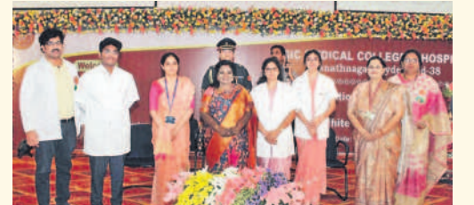
వైట్ కోట్ సెరిమనీలో విద్యార్థులతో గవర్నర్ తమిళిసై

అమీర్పేట్, డిసెంబర్ 15 : అవయవ దానాలు చేసే వారు ఆదర్శ ప్రాయులని, అటువంటి అవయవ దానాల పట్ల ప్రజల్లో మరింత అవగాహన కల్పించాలి అవసరమంది