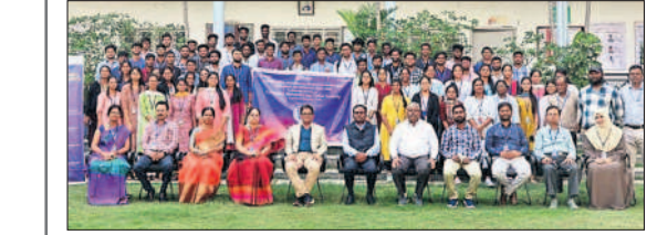
అనురాగ్ యూనివర్సిటీలో జరిగిన సదస్సులో పాల్గొన్న అధ్యాపకులు, విద్యార్థులు