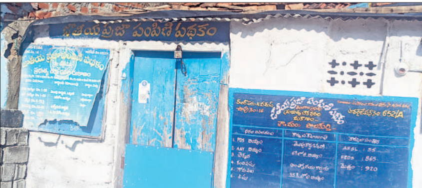
పాలకుర్తిలోని రేషన్ షాపు