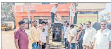
స్టేషన్ ఘనపూర్వం : పాట్టి శ్రీరాములు విగ్రహం వద్ద నివాళులర్పిస్తున్న ఆర్కవైశ్యులు