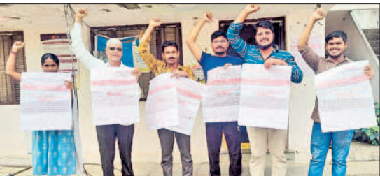
దేవరపల్లెలో నినాదాల చేస్తున్న తపాలా ఉద్యోగులు

జనగామ చౌరస్తా, డిసెంబర్ 15 : జనగామ జిల్లా స్థాయి యువ కళాకారుల ఎంపిక కార్యక్రమం డిసెంబర్ 23వ తేదీ ఉదయం 9గంటలకు స్థానిక జూబ్లీ ఫంక్షన్ హాల్‌లో నిర్వహించనున్నట్లు జిల్లా యువజన, క్రీడల అధికారి (ఇన్‌చార్జ్) రంగాచారి శుక్రవారం ఒక ప్రకటనలో తెలిపారు. జిల్లాలో 15నుంచి 29ఏళ్లలోపు ఉన్న యువ కళాకారులు అర్హులని ఆయన తెలిపారు. యువ కళాకారులకు జానపద నృత్యం (సోలో/ గ్రూపు డ్యాన్స్), జానపద గేయాల (సోలో/ గ్రూపు డ్యాన్స్)తో పాటు లైవ్ స్క్విల్స్ కాంపోజింగ్ విభాగంలో కథా రచన, పోస్టర్ మేకింగ్, ప్రకటన (డిజైనింగ్), ఫోటోగ్రఫీలో పోటీలు ఉంటాయని తెలిపారు. దేశభక్తి, సందేశాత్మకంగా ఉండే అంశాలనే పోటీదారులు ఎంపిక చేసుకోవాలని సూచించారు. వివరాలకు సెల్ నంబర్ 9703033348 లేదా 9182552593లో సంప్రదించాలన్నారు.