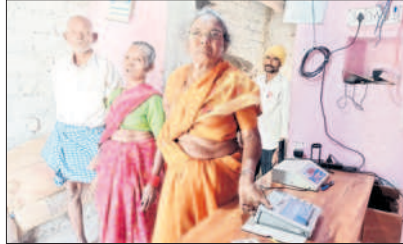
రేషన్ షాపులో ఈకేవైసీ చేసుకుంటున్న లబ్ధిదారులు

జిల్లాలో ఇప్పటి వరకు 66.89శాతం వరకు పూర్తి చేశారు. జిల్లాలో మొత్తం 4లక్షల85వేల910 మంది లబ్ధిదారులు ఉండగా ఇప్పటి వరకు ఈ-కేవైసీ 3లక్షల25వేల7మంది నమోదు చేశారు. మిగిలిన వారు తప్పని సరిగా జనవరి 31 లోపు ఈకేవైసీ నమోదు చేసుకోవాల్సి ఉంది.