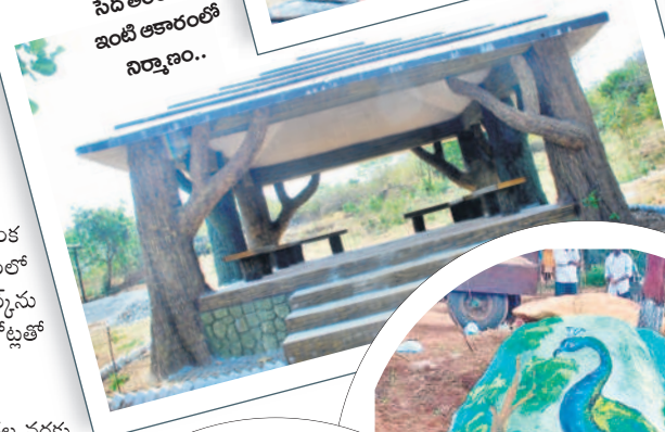
సేద తీరేందుకు ఇంటి ఆకారంలో నిర్మాణం..