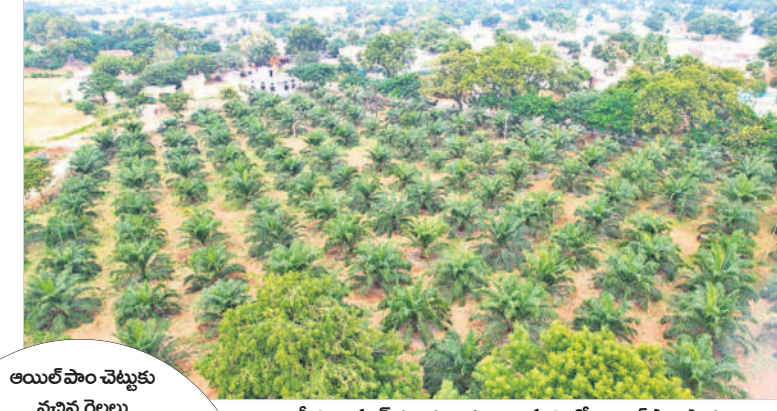
ఆయిల్ పాం చెట్లకు వచ్చిన గెలులు