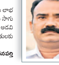
ఆయిల్ పాం తో రైతులకు లాభాలు..