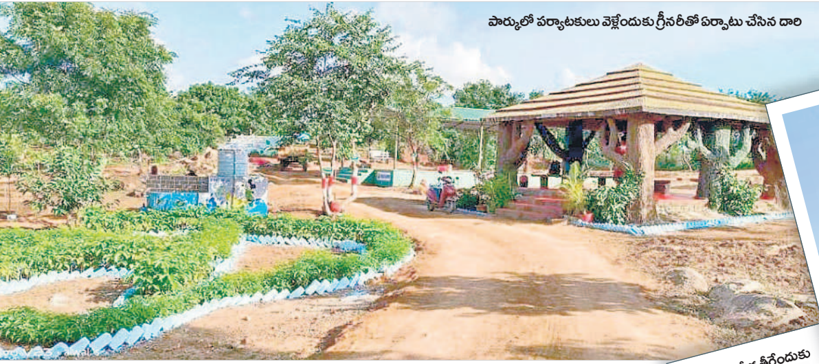
పార్కులో పర్యాటకులు వెళ్లొందుకు గ్రీన రీతో ఏర్పాటు చేసిన డారి