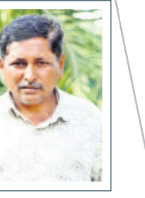
ఆయిల్ పాం తో రైతులకు లాభాలు..