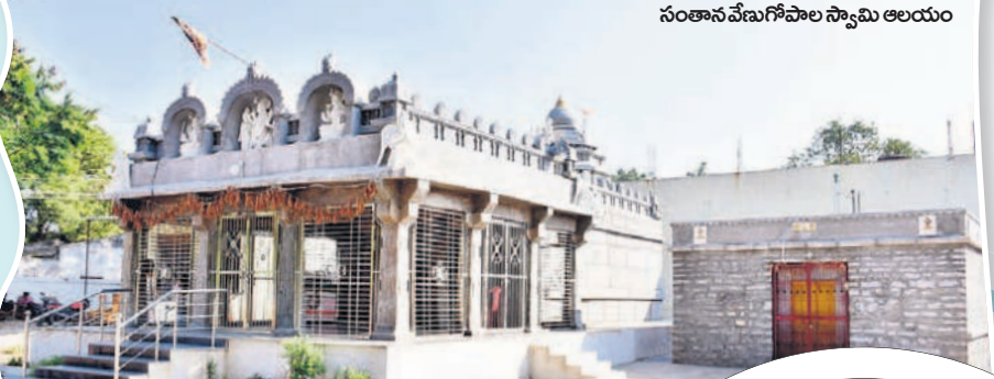
సంతానవేణగోపాల స్వామి ఆలయం