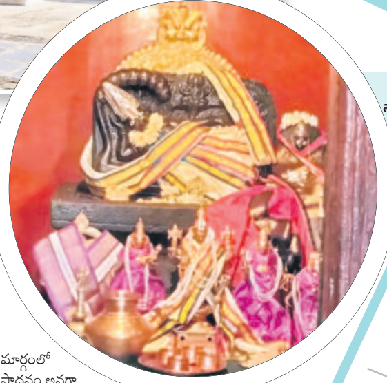
శ్రీ రంగ నాథ స్వామి

సూర్యుడంటే కాలం ధనుర్మాసం. గోదాదేవి కథ ఈ మాసానికి సంబంధించినదే కావడం వల్ల తిరుప్పావై పఠనం, గోదాదేవి కల్యాణం, అండాక్షయ్య పూజలు ఈ మాసంలోనే నిర్వహిస్తారు. తిరుమలలో సుప్రభాతానికి బదులు తిరుప్పావై పాఠాంతోనే ఈ మాసానికి ఉన్న పవిత్రత ఎంతటిదో తెలుస్తున్నది. ఆలయాల్లో జరిగే ఆగమశాస్త్ర కైలంకార్యాలలో స్థానిక ఆచార వ్యవహారాలు, సంప్రదాయాలు కలిసిన ఆంధ్రాంధ్రం ముందు ప్రారంభమవుతుంది. అదివారం నుంచి జనవరి 16వ తేదీ వరకు ధనుర్మాసం ఉంటుంది. ధనుర్మాసమంటే.. ధనుర్మాసంలో ధనుర్మాసానికి సూర్యుడు ప్రవేశించిన సమయం ధనుర్మాసం ప్రకటన. ధనుర్మాసం