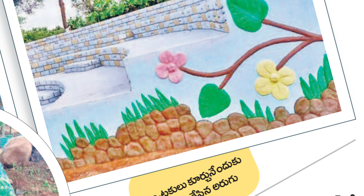
పర్యాటకులు కూర్చోవేందుకు ఏర్పాటు చేసిన అరుగు