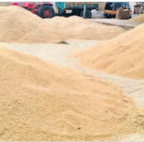
బాదేపల్లి వ్యవసాయ మార్కెట్కు అమ్మకానికి వచ్చిన ధాన్యం

111క్వింటాళ్ళ సోన రకం ధాన్యం అమ్మకానికి రాగా క్వింటాకు గరిష్ఠంగా రూ.2,460 ధర పలికింది. అదేవిధంగా మార్కెట్కు 81 క్వింటాళ్ళ వేరుశనగ అమ్మకానికి రాగా దానికి క్వింటాకు గరిష్ఠంగా రూ.8,040 ధర పలికింది. అదేవిధంగా మార్కెట్కు 5క్వింటాళ్ళ రాగులు అమ్మకానికి రాగా క్వింటాకు గరిష్ఠంగా రూ.3,517 ధర పలికింది. మధ్యతూ ధర కంటే రూ. 1,100 ఎక్కువ గద్వాల అర్బన్, డిసెంబర్ 15 : సన్న ధాన్యం ధర గతంలో ఎన్నడూ లేని విధంగా రికార్డు పలుకుతుంది. గద్వాల మార్కెట్ చరిత్రలో ఎన్నడూ లేని విధంగా క్వింటా రూ.3,413 ధరలు పలుకుతున్నాయి. గత సీజన్లో రూ.2,300 ధరల పైగా పలికితే.. ప్రస్తుతం రూ.3,413 ధరలు నడుస్తున్నాయి. గతంలో కంటే వెయ్యి రూపాయలు అధిక ధరలు రావడం రైతుల సంతోషానికి అవధులు లేవు. ధాన్యానికి మంచి ధర