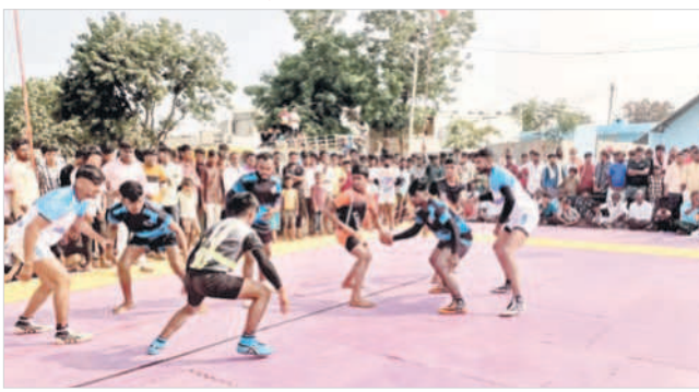
కొత్తపల్లిలో కబడ్డీ పోటీల్లో తలపడుతున్న జట్లు