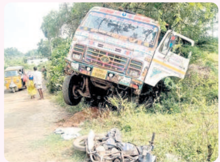
ప్రమాద స్థలంవద్ద లారీ, ద్విచక్ర వాహనం

బోనకల్లు, డిసెంబర్ 15: గోవిందాపురం-ఏ గ్రామంలోని రైల్వేగేటు వద్ద పెనుప్రమాదం తప్పిన ఘటన శుక్రవారం చోటు చేసుకున్నది. మధిర నుంచి కంకర లోడ్తో వస్తున్న లారీ రైల్వేగేటు మూసి ఉండటంతో డ్రైవర్ లారీ నిలిపివేశాడు. రైల్వేగేటు తీసిన వెంటనే వెళ్తున్న ఉండగా లారీ ముందుకు వెళ్లే క్రమంలో అదుపు తప్పి వెనక్కు రావడంతో ప్రమాదం చోటు చేసుకున్నది. అధిక లోడ్తో ఉన్న లారీ వెనుక ఉన్న వాహనదారులు తమ వాహనాలను వదిలేసి పరుగులు తీశారు. లారీ బైక్ పై నుంచి వెళ్లేడంతో ద్విచక్ర వాహనం నుజ్జునుజ్జు అయింది. అధికారులు స్పందించి ఓవర్లోడ్తో వస్తున్న లారీ డ్రైవర్లకు, రైల్వే కాంట్రాక్టర్లకు జాగ్రత్తలు తీసుకోవాలని ప్రజలు కోరుతున్నారు.