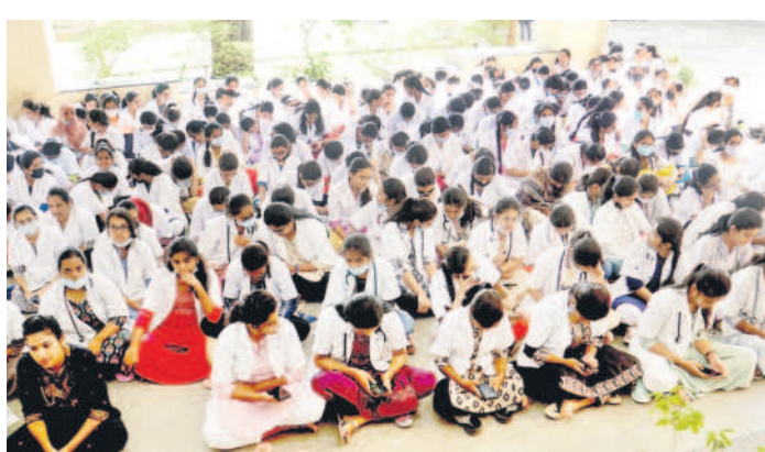
అదిలాబాద్ లోని లిమ్స్ లో నిరసన తెలుపుతున్న వైద్య విద్యార్థులు

- కుమ్రం భీం ఆసిఫాబాద్ (నమస్తే తెలంగాణ) / కె.రమేష్, డిసెంబర్ 15