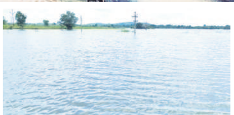
నీటితో కళకళలాడుతున్న బావాపూర్ చెరువు

నిర్మల్ జిల్లాలో యాసంగి సీజన్కు సంబంధించి ఆయా పంటల సాగుకు అవసరమైన నీరందించేలా జిల్లా నీటి పారుదల శాఖ సిద్ధంగా ఉంది. ఏటా ఈ సమయంలో రైతాంగం ఆరుతడి పంటల సాగుకే మొగ్గు చూపుతున్నది. అయితే ఈ సారి భారీ వర్షాల కారణంగా ప్రాజెక్టులు, చెరువులు జలకళను సంతరించుకోగా, 1,73,650 ఎకరాల్లో ఆయా పంటలకు సకాలంలో నీరందించేందుకు అధికార యంత్రాంగం ఏర్పాట్లు చేస్తున్నది. అత్యధికంగా కడెం ప్రాజెక్టు కింద 65 వేల ఎకరాలతో పాటు 734 చెరువుల ద్వారా పూర్తి స్థాయి ఆయకట్టుకు నీరందనున్నది. ఈ నేపథ్యంలో ఈ సీజన్లో ఏటా కంటే పంటల సాగు విస్తీర్ణం మరింత పెరిగే అవకాశమున్నది. - నిర్మల్, డిసెంబర్ 15 (నమస్తే తెలంగాణ)