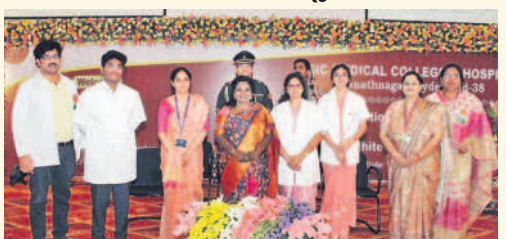
వైట్ కోట్ సెరిమనీలో విద్యార్థులతో గవర్నర్ తమిళిసై

గవర్నర్ తమిళిసై అమీర్ హేట్, డిసెంబర్ 15 : అవయవ దానాలు చేసే వారు ఆదర్శ ప్రాయులని, అటువంటి అవయవ దానాల పట్ల ప్రజల్లో మరింత అవగాహన కల్పించాలి అవసరమని గవర్నర్ తమిళిసై సొందరరాజన్ అన్నారు. శుక్రవారం సనత్ నగర్ ఈఎస్ఎస్ వైద్య కళాశాలలో జరిగిన అవయవ దాతల సన్మానం, మొదటి సంవత్సరం ఎంటీబీఎస్ విద్యార్థులకు జరిగిన వైట్ కోట్ సెరిమనీలకు గవర్నర్ తమిళిసై ముఖ్య అతిథిగా హాజరయ్యారు. ఈ సందర్భంగా గవర్నర్ మాట్లాడుతూ ఎంటీబీఎస్ మొదటి సంవత్సరం విద్యార్థులు 125 మందికి జరిగిన వైట్ కోట్ సెరిమనీ ఆద్యంతం