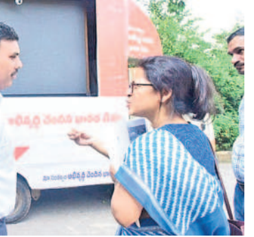
వికసిత భారత్ సంకల్ప యాత్ర రథాలను పరిశీలిస్తున్న డైరెక్టర్ పాసుమి బసు

సంగారెడ్డి కలెక్టరేట్, డిసెంబర్ 15: సంగారెడ్డి జిల్లాలో వికసిత భారత్ సంకల్ప యాత్రను విజయవంతం చేయాలని కేంద్ర ప్రభుత్వ మినిస్ట్రీ ఆఫ్ హోమ్ అఫైర్స్ డైరెక్టర్ పాసుమిబసు పిలుపునిచ్చారు. శుక్రవారం కలెక్టరేట్లోని సమావేశ మందిరంలో కలెక్టర్, అదనపు కలెక్టర్, వివిధ శాఖల అధికారులతో వికసిత యాత్రపై పాసుమిబసు సమావేశం నిర్వహించారు. ఈ సందర్భంగా ఆమె మాట్లాడుతూ కేంద్రప్రభుత్వం అమలుచేస్తున్న వివిధ పథకాలు అర్హులైన ప్రతిఒక్కరికీ చేరాలి అధికారులు ప్రత్యేక దృష్టి సారించాలని పేర్కొన్నారు. కేంద్ర ప్రభుత్వం ఆమలు చేస్తున్న వివిధ పథకాలు గ్రామ రూల్ రెవెల్ చేయకపోవద్దని వికసిత భారత్ సంకల్ప యాత్ర ప్రధాన ఉద్దేశమన్నారు. వికసిత భారత్ సంకల్ప యాత్ర ప్రచార రథాలను ఈ నెల 16న సాయంత్రం 4 గంటలకు భారత ప్రధాని నరేంద్ర మోడీ వర్చువల్గా ప్రారంభిస్తారని తెలిపారు. జిల్లాకు 10 ప్రచారరథాలను కేటాయించారు. ఆయా వాహనాల్లో పీఎం మనోజ్ ఆడియో, వీడియోతో ఉంటుందన్నారు. ఈనెల 16 నుంచి వచ్చే నెల 25 వరకు ఒక్కో వాహనం రెండు గ్రామ పంచాయతీలకు వెళ్తుందన్నారు. ఆ దిశగా ప్రణాళిక చేసుకోవాలని అధికారులకు సూచించారు. కలెక్టర్ శరత్ మాట్లాడుతూ వికసిత భారత్ సంకల్ప యాత్రలో భాగంగా జిల్లాకు 10 మొబైల్ వ్యాన్లు పంపాయని తెలిపారు. షెడ్యూలు మేరకు ప్రతి వాహనం ప్రత్యేకంగా రెండు గ్రామ పంచాయతీలకు కనీసం రెండు రోజులు తీసుకుంటామన్నారు. కార్యక్రమంలో అదనపు కలెక్టర్ చంద్రశాఖర్, డీఆర్వో సగో, వివిధ శాఖల జిల్లా అధికారులు, డివిజన్ల పంచాయతీ అధికారులు, ఎంపీఎస్ పాల్గొన్నారు.