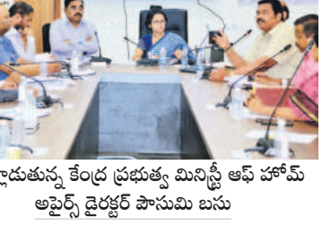
మాట్లాడుతున్న కేంద్ర ప్రభుత్వ మినిస్ట్రీ ఆఫ్ హోమ్ అఫైర్స్ డైరెక్టర్ పాసుమి బసు

మెడక్ కలెక్టరేట్, డిసెంబర్ 15: కేంద్ర ప్రభుత్వం అమలు చేస్తున్న వివిధ పథకాలు అర్హులైన ప్రతి ఒక్కరికీ అందాలి అధికారులు ప్రత్యేక దృష్టి సారించాలని కేంద్ర ప్రభుత్వ మినిస్ట్రీ ఆఫ్ హోమ్ అఫైర్స్ డైరెక్టర్ పాసుమిబసు అన్నారు. శుక్రవారం కలెక్టరేట్లోని వీడియో సమావేశ మందిరంలో అదనపు కలెక్టర్ వెంటకేశ్వర్లు, జిల్లా అధికారులతో వికసిత భారత్ సంకల్ప యాత్రపై పాసుమిబసు సమావేశం నిర్వహించారు. ఈ సందర్భంగా ఆమె మాట్లాడుతూ కేంద్ర ప్రభుత్వం అమలుచేస్తున్న వివిధ పథకాలు అర్హులైన ప్రతి ఒక్కరికీ చేరాలి అధికారులు ప్రత్యేక దృష్టి సారించాలని పేర్కొన్నారు. కేంద్ర ప్రభుత్వం అమలు చేస్తున్న వివిధ పథకాలు గ్రామ రూల్ రెవెల్ చేయకపోవద్దని వికసిత భారత్ సంకల్ప యాత్ర ప్రధాన ఉద్దేశమన్నారు. వికసిత భారత్ సంకల్ప యాత్ర ప్రచార రథాలను ఈ నెల 16న సాయంత్రం 4 గంటలకు భారత ప్రధాని నరేంద్ర మోడీ వర్చువల్గా ప్రారంభిస్తారని తెలిపారు. జిల్లాకు 10 ప్రచార రథాలను కేటాయించారు. ఆట్టి వాహనాల్లో ప్రచారమంపిం మనోజ్ ఆడియో, వీడియోతో ఉంటుందన్నారు. ఈ నెల 16 నుంచి వచ్చే నెల 25 వరకు ప్రతి రోజూ ఒక్కో వాహనం రెండు గ్రామ పంచాయతీలకు వెళ్తుందన్నారు. అందుకు రూల్ మ్యాన్ యాక్షన్ ప్లాన్ సిద్ధం చేసుకోవాలని అన్నారు. ప్రజలు అట్టి క్యాంపులకు హాజరయ్యాలి చూడాలి న్నారు. కార్యక్రమంలో డీఆర్ఎస్ టి.వి.వారి, ఎంపీఎస్, విడిఎంపీ మార్పు, డిఎంఆర్ఎస్.పి. చందూయర్, డిడి. గోవింద్, డి.జి. రాధాకృష్ణ తదితరులు పాల్గొన్నారు.