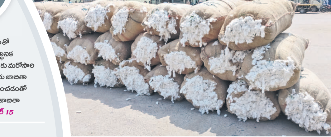
గజ్వేల్ వ్యవసాయ మార్కెట్ యార్డుకు రైతులు తీసుకువచ్చిన పత్తి